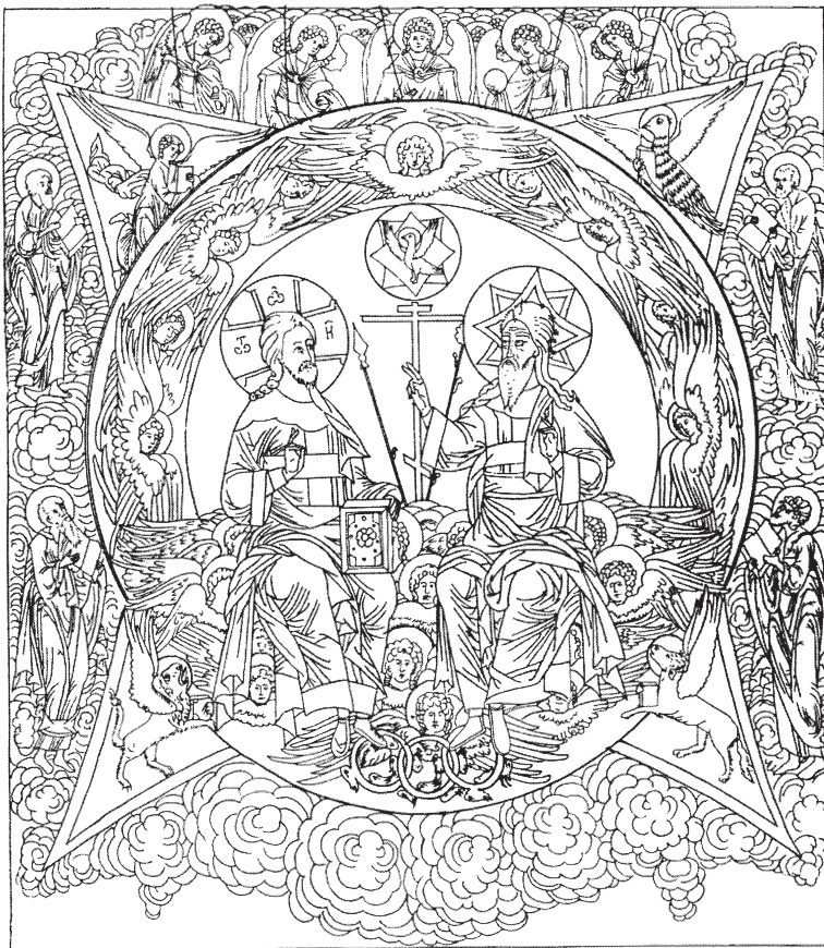
Древнерусское символическое изображение – икона Св. Троицы.

Телесное место есть граница содержащего и его содержимого; например, воздух содержит, а тело содержится. Но не весь содержащий воздух есть место тела содержимого, а только граница содержащего воздуха, объемлющая содержимое тело. Вообще же (нужно знать), что содержащее не заключается в содержимом.