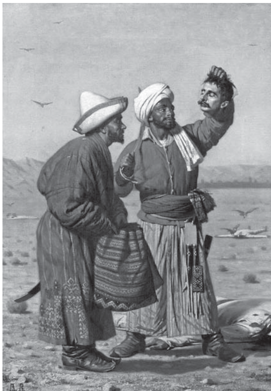
После удачи. Картина худ. В.Верещагина.

– Братцы казаки! – обратился он перед прорывом к остаткам своей сотни (под ружьём, включая раненных, оставалось около шестидесяти человек), – не посрамите славы русского оружия! Ведь сегодня – великий праздник у православных: с нами Никола Чудотворец!