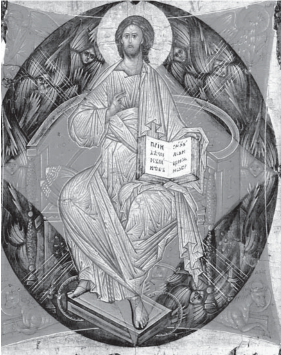
«Спас в Силах»: изображение Господа по видению прор. Иезекииля. Икона прп. Андрея Рублева.

Во всех народах и во всяком человеке есть стремление к познанию Бога. Не все одинаково знают и понимают Создателя, некоторые даже принципиально отвергают любую религию и объявляют в безумии, что Бога нет, но в каждом, даже в последнем безбожнике от рождения заложена «тоска по небу», то, что отрывает человека от «животных потребностей». Верховный Апостол Павел, проповедник тайны Христовой, стоя в афинском Ареопаге, открывал греческим философам смысл человеческой жизни: Бог произвёл всех людей от одной крови, то есть от Адама, чтобы жили по всему лицу земному; Он установил времена и пределы их обитанию, чтобы они искали Господа: если взыщут Его, то найдут, потому что Он недалеко от каждого из нас, ведь Им мы живём, и движемся, и существуем. (Деян. 17:26-27) .