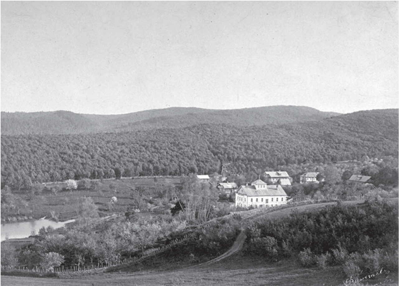
Вид на Серапионов монастырь с северной стороны. Фото 1880-х гг.

Проснулась весна, – разбудила всё; поднялась она, – ожило кругом; в сладостной неге потянулась весна, – разукрасился мир; улыбнулась она, – и разом запели ей хвалебную песнь птиц голоса; потрянула лучезарною головкой, – и разлилась кипучая жизнь в мире Творца!