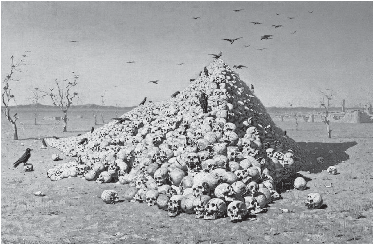
Апофеоз войны. Картина худ. В. Верецагина.

В свою очередь Алимкул и султан Садык отправляли головы русских солдат и казаков правителю Кашгара (ныне — Северо-Западная часть Синцзяна, Китай) Якуб-беку 4 , подданные которого на окраине города складывали пирамиды из черепов «неправовверных» (см. рисунки художника Верецагина).