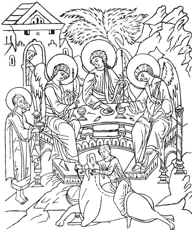
Прорись иконы «Гостеприимство Авраама» - изображение явления Св. Троицы в виде трех Ангелов св. праотцу Аврааму.