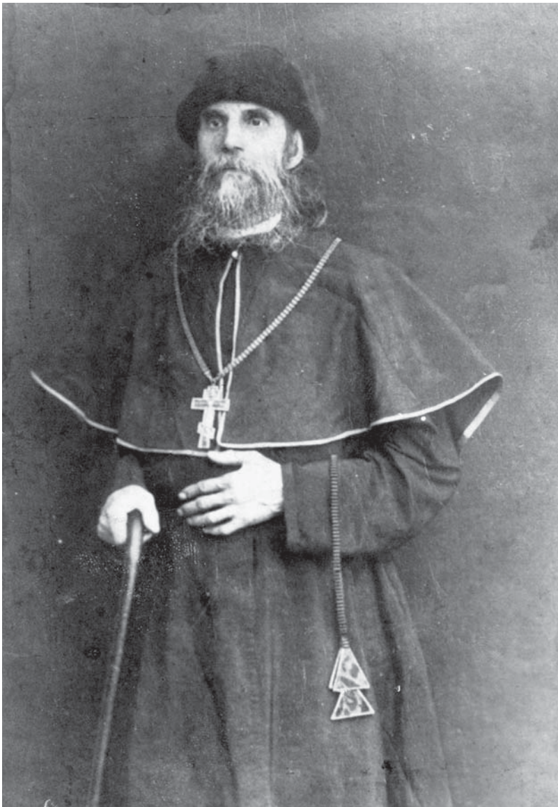
Преподобный Серапион, архимандрит Успенского мужского монастыря на Черемшане. Фото 1893 – 1897 гг.

Батюшка Серапион, старик лет шестидесяти, страшно близорук, высок ростом и очень худощав. Добрый, мягкий, восторженный. Серебристые волосы головы и бороды окаймляли продолговатое наивной юности лицо; мало продолговатый лоб резко выступал из-за глубоко впавших щек; под густыми бровями грустно и величественно глядели глубоко пронизывающие сероватые глаза;