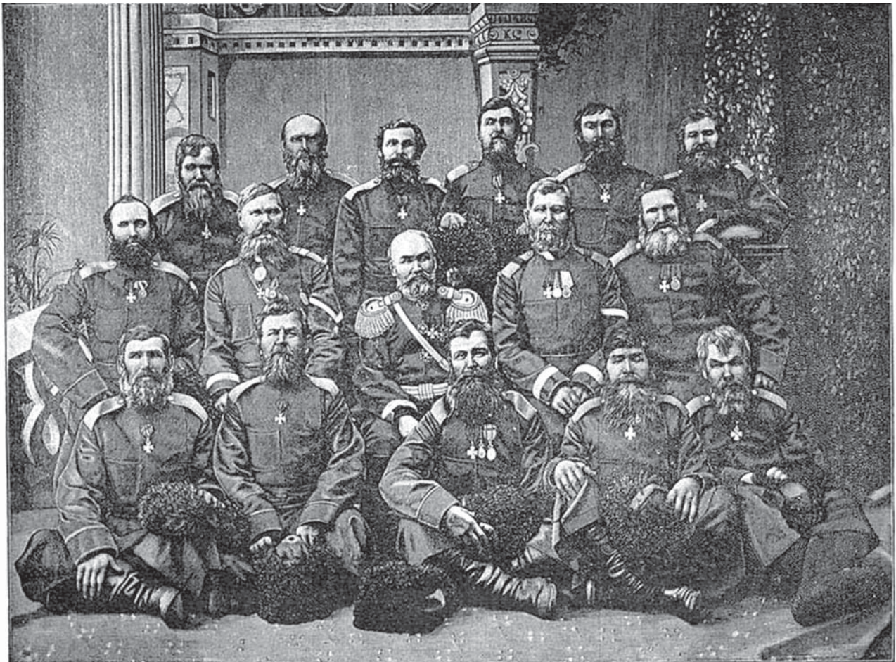
На фотографии: оставшиеся в живых ветераны Иканского боя в день 25-летия сражения (в центре – генерал-майор В.Р.Серов)

ходная церковь. В том же году в городе Уральске был освящён храм Святителя Николы (больше известный как Никольский походный храм).