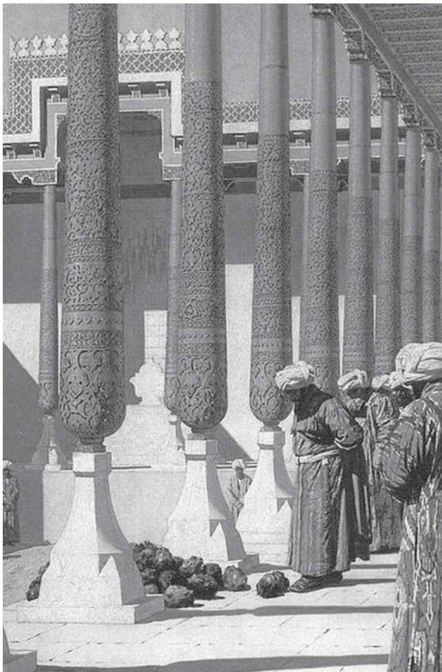
Представляют трофеи. Фрагмент картины худ. В. Верещагина.