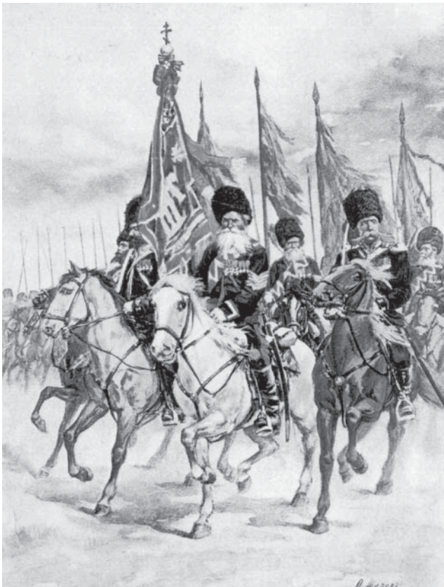
Уральские казаки с войсковым знаменем. 1891 г.

Одновременное наступление в июне 1864 г. отрядов полковника Вревкина со стороны Сыр-Дарьинской линии и генерала Черняева со сторо-