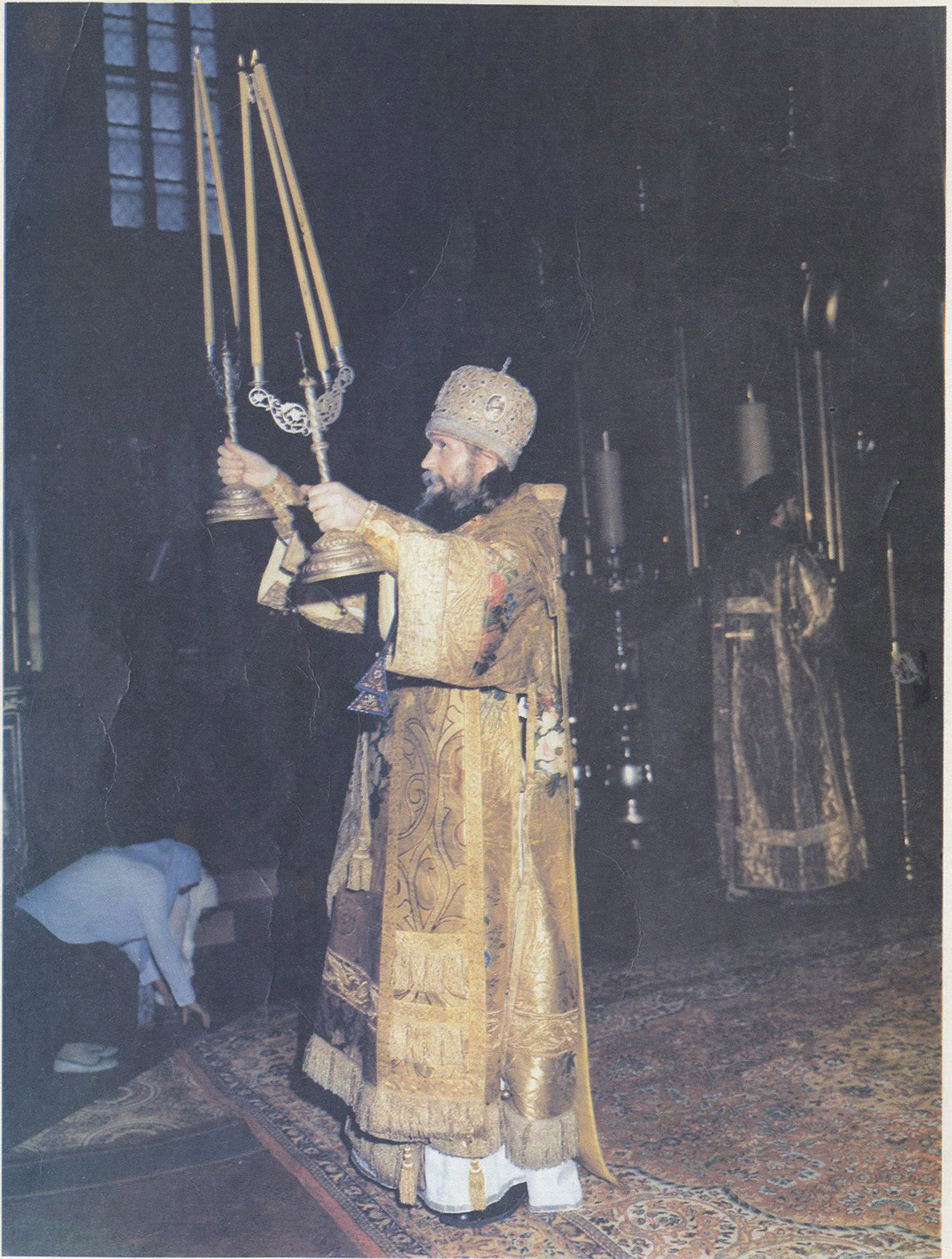
ВЫСОКОПРЕОСВЯЩЕННЕЙШИЙ АЛИМПИЙ Митрополит Московский и всея Руси