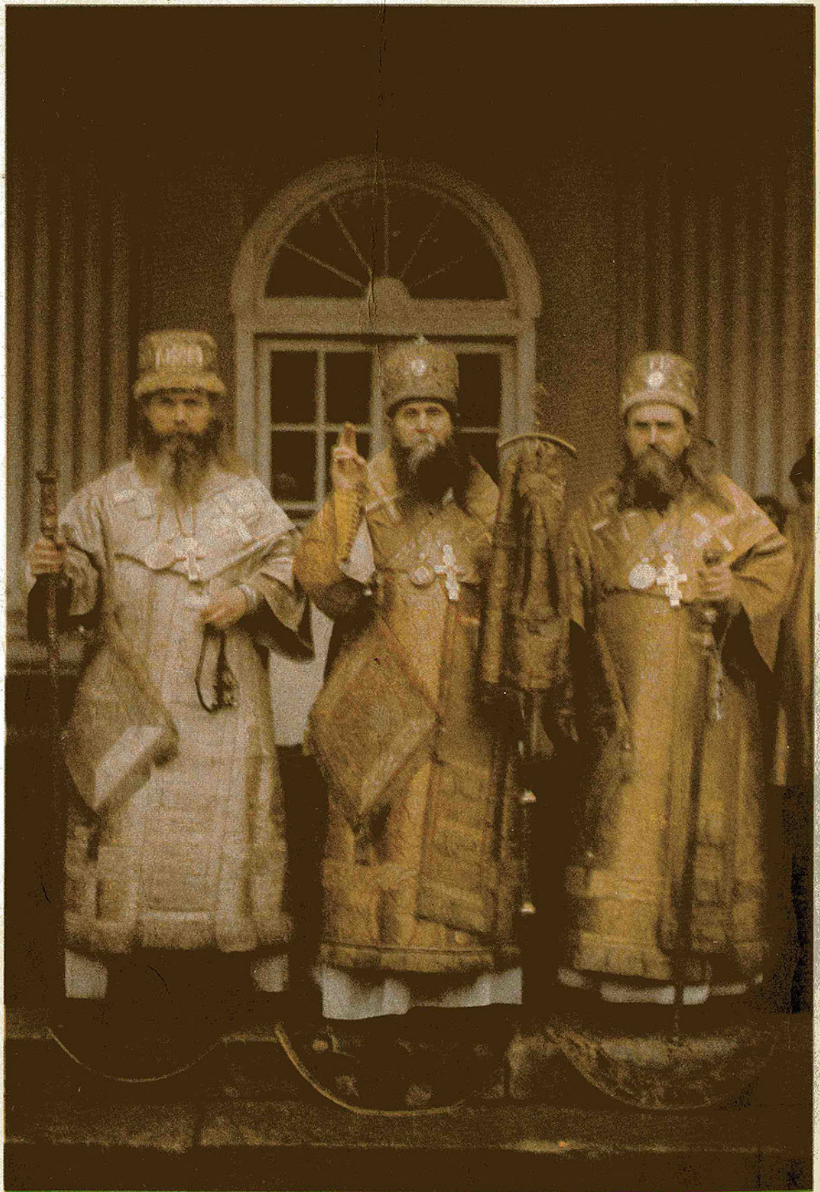
Глава Русской Православной Старообрядческой Церкви Митрополит Алимпий, Московский и всяя Руси (в центре); епископ Новосибирский и всяя Сибири Силуян (слева) и епископ Киевский и всяя Украины Иоанн (справа).