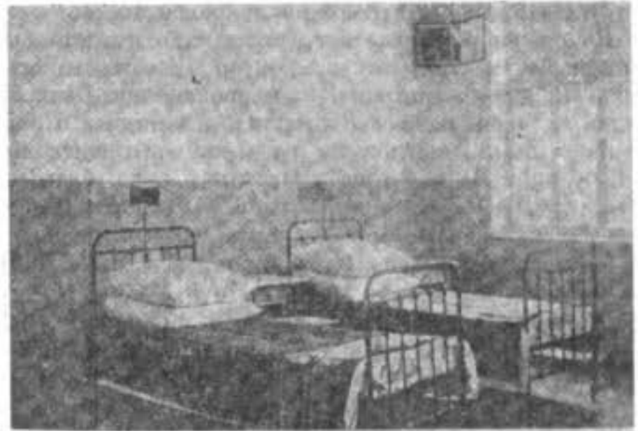
Внутренній видъ лѣчебницы.