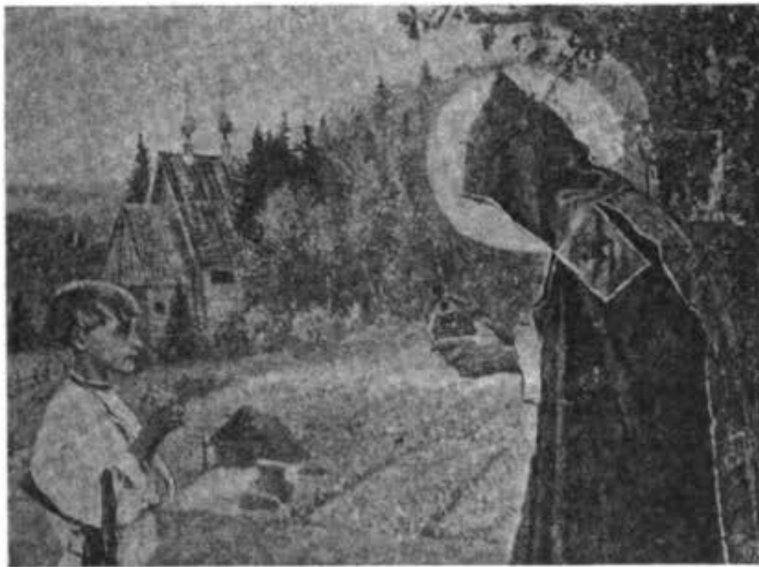
Видѣніе отроку Варооломею (мірское имя преподоби. Сергія Радонежскаго). Съ картины Нестерова.

Итогомъ пятидесятилѣтней дѣятельности преподобнаго Сергія было то, что русскіе люди, до этого трепетавшіе отъ одного имени татарина, теперь сами пошли на поработителей и свергли вѣковое иго. Великій борецъ