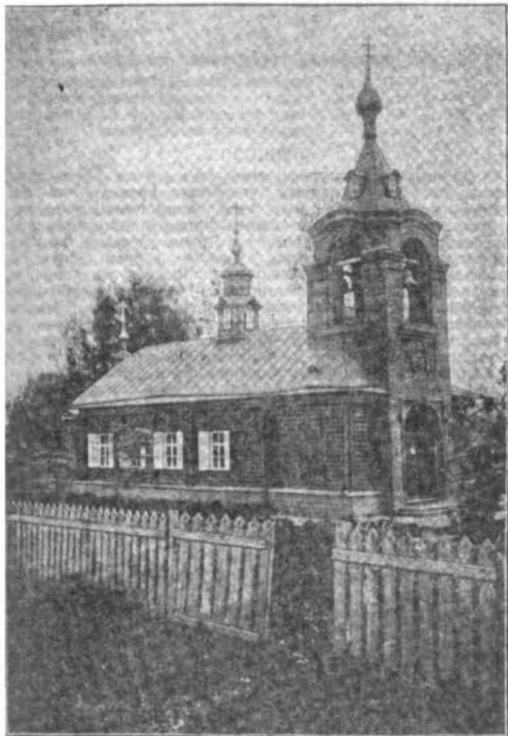
Храм во имя Рождества Пресвятыя Богородицы въ д. Тураево.