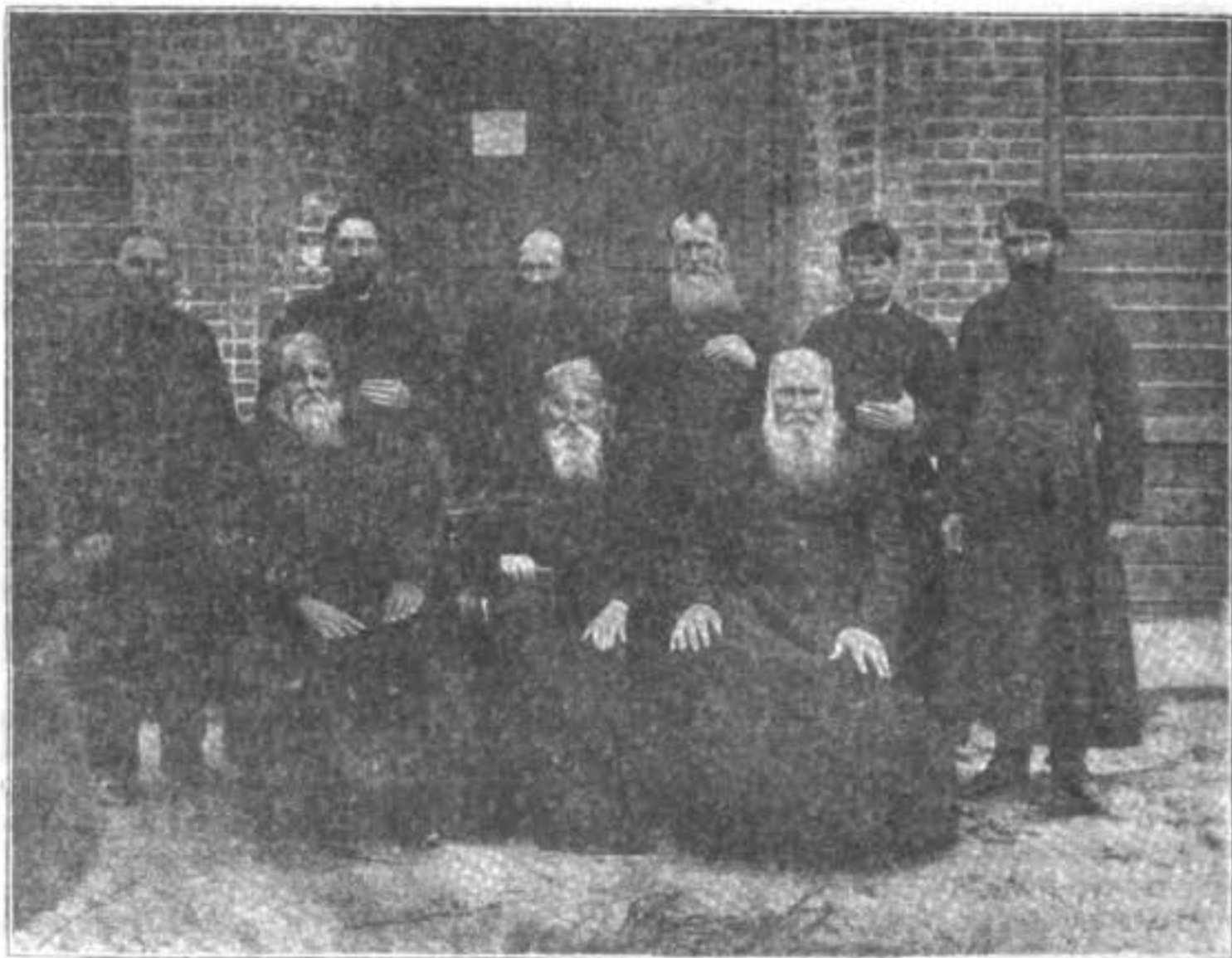
Совѣтъ старообрядческой общины въ д. Тураево