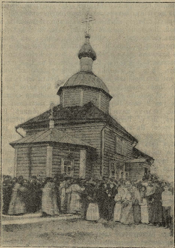
Храмъ въ селѣ Комельгино, Калужской губ. и уѣзда, во имя Василія Великаго, Григорія Богослова и Іоанна Златоуста.