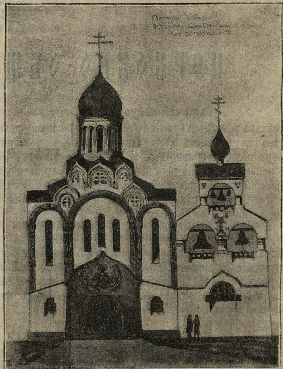
Проектъ храма богородско-глуховской старообрядческой общины въ г. Богородскѣ.