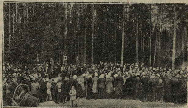
Закладка храма при старообрядческой богородско-глуховской общинѣ въ г. Богородскѣ.

богородскомъ храмѣ будетъ четырехъярусный изъ свѣтлаго дуба съ подборомъ иконъ ХVIII вѣка. Отопленіе храма во-