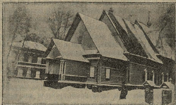
Городецкая старообрядческая часовня, построенная импер. Екатериной II, сгорѣла 17 мая 1898 г.

городскихъ бѣглопоповцевъ, поддерживаемый извѣстнымъ въ старообрядчествѣ крупнымъ благотворителемъ и церковно-общественнымъ дѣятелемъ Н. А. Бугровымъ. Съ давнихъ поръ здѣсь развивается церковная жизнь. Задолго еще до 1780 г. въ Городцѣ образовалось старообрядческое кладбище. На немъ въ царствованіи императрицы Екате-