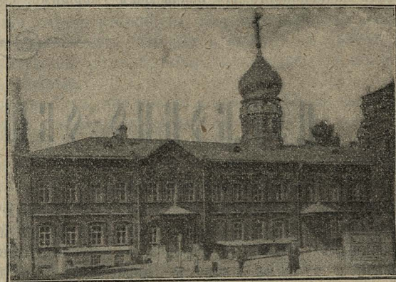
Новый городецкій старообрядческій Успенскій храмъ.

рины II съ ея разрѣшенія воздвигнута была деревянная часовня во имя Успенія Пресвятыя Богородицы и святителя Николы Чудотворца. Наканунѣ Срѣтенія Господня въ 1874 г. случился пожаръ въ часовнѣ, на ней сгорѣла крыша, прогорѣлъ потолокъ и уничтожена паперть. Стараніями прихожанъ часовня была возобновлена, но Божіимъ попущеніемъ въ 1893 г. часовня снова загорѣлась. На сей разъ она была истреблена пожаромъ до основанія. Погибло въ огнѣ много драгоценныхъ сокровищъ: церков-