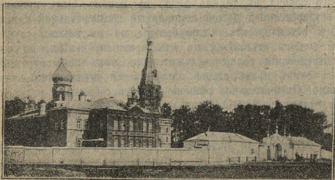
Городецкій старообрядческій Успенскій храмъ.

Городецъ, Нижегородской губ., населенъ преимущественно старообрядцами, пріемлющими священство, переходящее отъ господствующей церкви. Здѣсь центръ ниже-