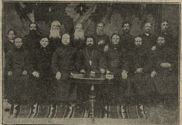
Причтъ городецкаго старообряд. Успенскаго храма.