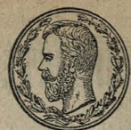
Гостовъ на-Дону. Золотая медаль.