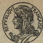
Марсель, Франція. Золотая медаль.