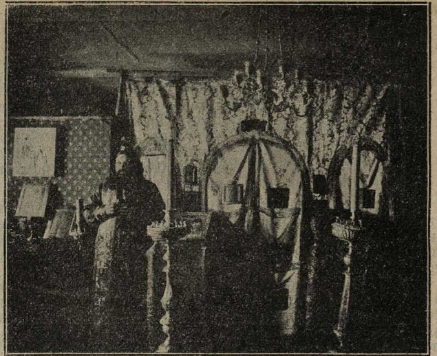
Внутренній видъ стараго храма въ с. Порѣчье, Калужск. губ.

Громадная масса молящихся, собравшаяся изъ всѣхъ окрестныхъ селъ и деревень, наполняла новый просторный и великолѣпно отдѣланный храмъ, который является первымъ въ Калужской губерніи по своей внѣшней и вну-