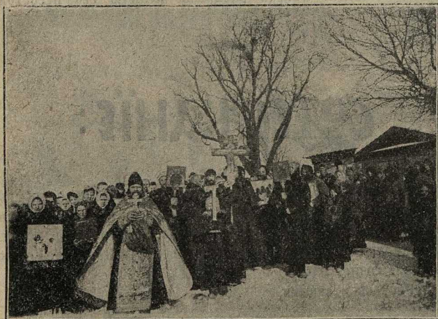
Крестный ходъ во время освященія храма въ с. Порѣчьѣ, Калужск. губ.