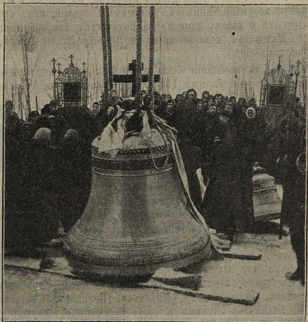
Освященіе колоколовъ и поднятіе въ с. Порѣчьѣ, Калужск. губ.

II отдѣленіе : 7) „На рѣцѣ Вавилонстѣй“ и „Покаянія отверзи ми двери“, хоръ пѣвцовъ и любителей; 8) „Краткій