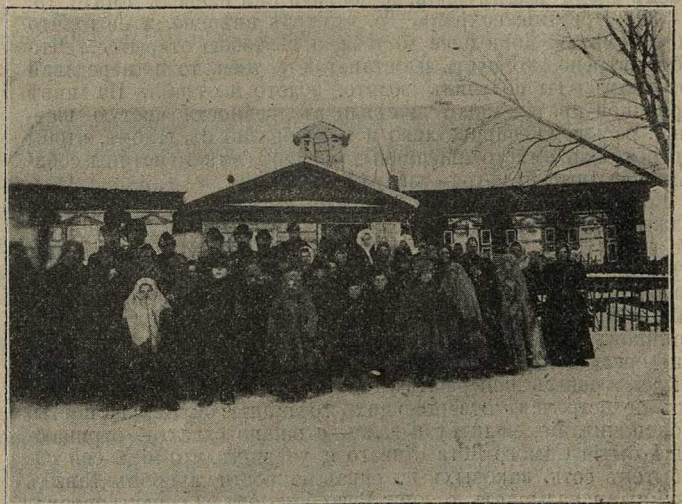
Отмолились послѣдній разъ въ старомъ храмѣ 2 февраля 1911 г. въ с. Порѣчье, Калужск. губ.

Итакъ, старообрядчество украсилось еще однимъ роскошнымъ чертогомъ Божиимъ, въ которомъ будутъ возноситься горячія молитвы Творцу во славу и честь родного старообрядчества.