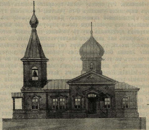
Проектъ старообрядческаго храма въ д. Ершовкѣ, Хвалынскаго у., Саратовской губ.

Совѣтъ ершовской общины, покорнѣйше проситъ пожертвованіе посылать по слѣдующему адресу: въ деревню