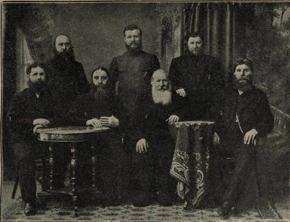
Члены совѣта старообрядческой общины въ г. Минусинскѣ.