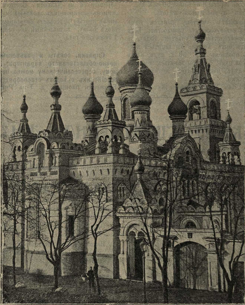
Новый храмъ въ Одессѣ.

Іоаннъ обратился къ прихожанамъ съ словомъ, въ которомъ выяснилъ то великое значеніе акта 17 апрѣля 1905 года, каковымъ нашъ любвеобильный Монархъ даровалъ своимъ вѣрнопопавшимъ свободу вѣроисповѣданія. Благодаря ему Монаршему соизволенію явилась возможность соорудить такой великолѣпный храмъ, какъ нынѣ освященный, въ которомъ за Государя Императора и всѣхъ христіанъ приносятся молитвы Всемогущему Богу.