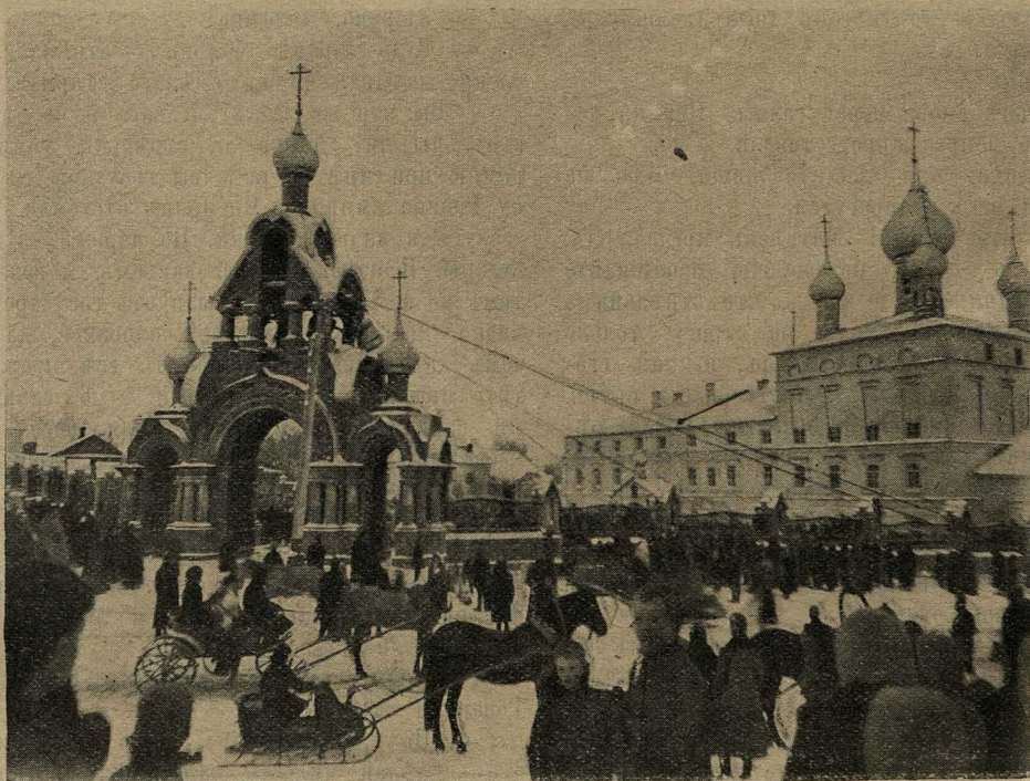
Поднятіе большого колокола. Общій видъ храма и звонницы иваново-вознесенской старообрядческой общины.