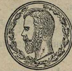
Гостовъ на-Дону. Золотая медаль.