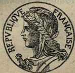
Марсель, Франція. Золотая медаль.