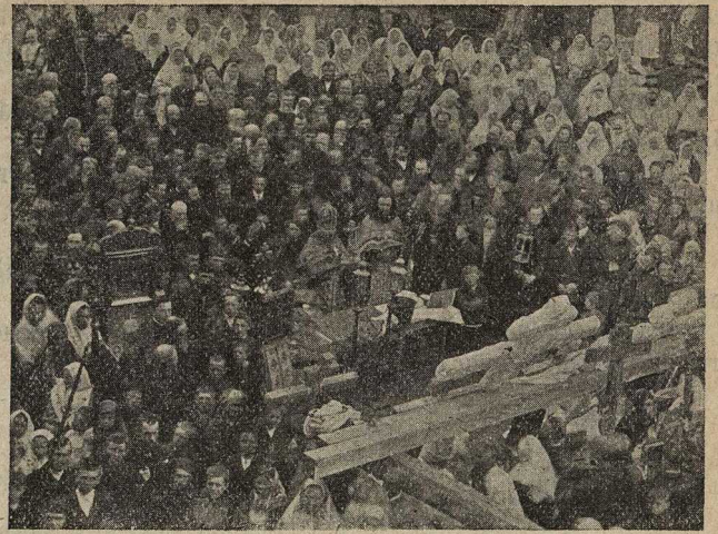
Молебенъ при поднятіи крестовъ на храмъ въ посадѣ Добрянка, Черниговской губ.

Многіе со слезами на глазахъ говорили: „Воистину въ наши времена сбылися слова Ісуса Христа, сказанныя ученикамъ: Блаженіи очи видящія, яже вы видите. Многіе наши предки хотѣли это видѣть, но не сподобились“. Когда крестъ приблизился къ мѣсту водруженія и былъ постав-