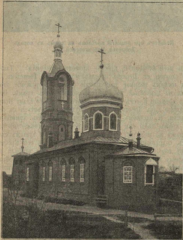
Каменный старообрядческій храмъ во имя Покрова Пресвятой Богородицы Покровской селезневской старообрядческой общины Бѣлокриницкой митрополіи, при деревнѣ Селезневой, Рязанскаго уѣзда, построенъ въ 1905--1908 годахъ.

Открылась подписка,—результатъ получился удивительный: подписано болѣе 5 тысячъ рублей.