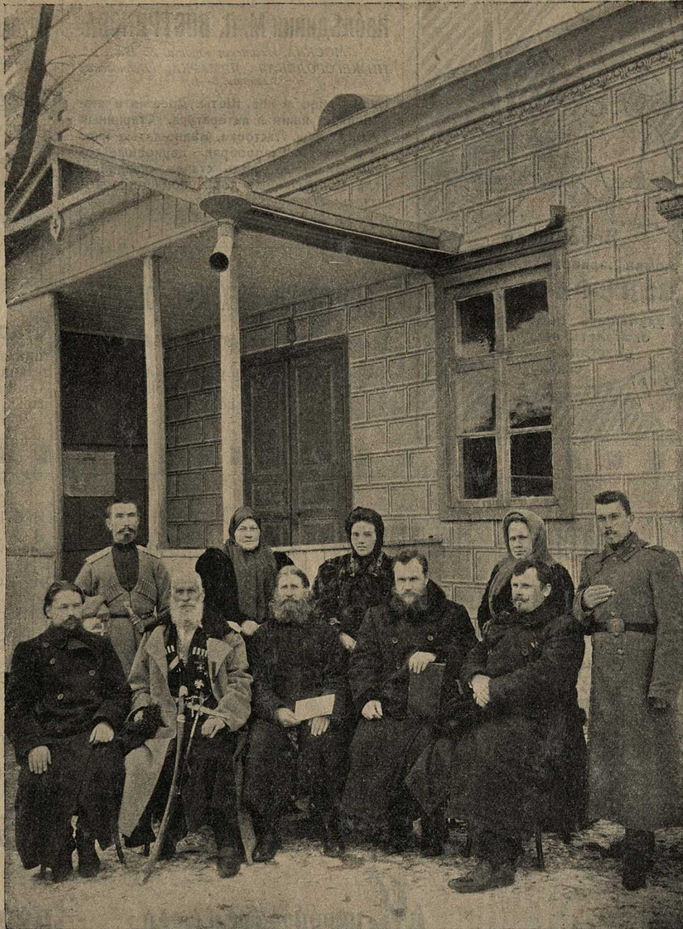
Представители владикавказской общины.

Участвовали въ крестномъ ходѣ, кромѣ своихъ христіанъ, беспоповцы и никоніане. Мѣстные новообрядческіе пастыри въ этотъ день никогда не совершали крестнаго хода, но на этотъ разъ совершили и они съ пѣлью повредить старообрядцамъ и отвлечь своихъ, но это не подѣйствовало и не отвлекло симпатизирующихъ старообрядческому крестному ходу; все-таки они пошли за нимъ не въ меньшемъ числѣ, чѣмъ въ прошлые годы.