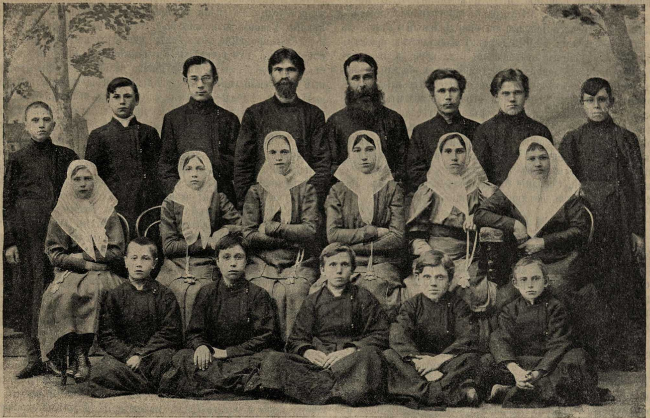
Хоръ любителей при коломенской старообрядческой общинѣ.

койствѣи прешель крестный ходъ черезъ весь городъ, провожая Царицу Небесную; здѣсь, на пути своего слѣдованія, встрѣчали ее и прикладывались къ ней и самые закоренѣлые неокружники мѣстнаго раздорническаго еп. Іова прихода.