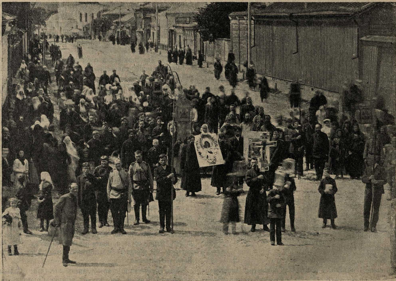
Крестный ходъ въ Коломнѣ.

Служба свершалась весьма чинно, а прекрасно исполненныя пѣснопѣнія мѣстными любителями пѣнія придавали службѣ еще большую красоту. Въ полномъ порядкѣ и спо-