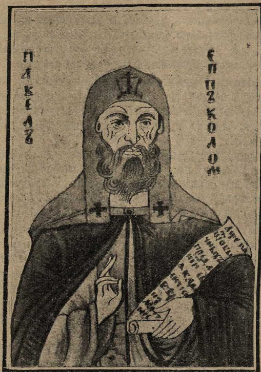
Епископъ Павелъ Коломенскій.

всемощною властію вооружена, еретическая шатанія низлагающа и анаемѣ предающа, православныхъ же соборы благославляюща.