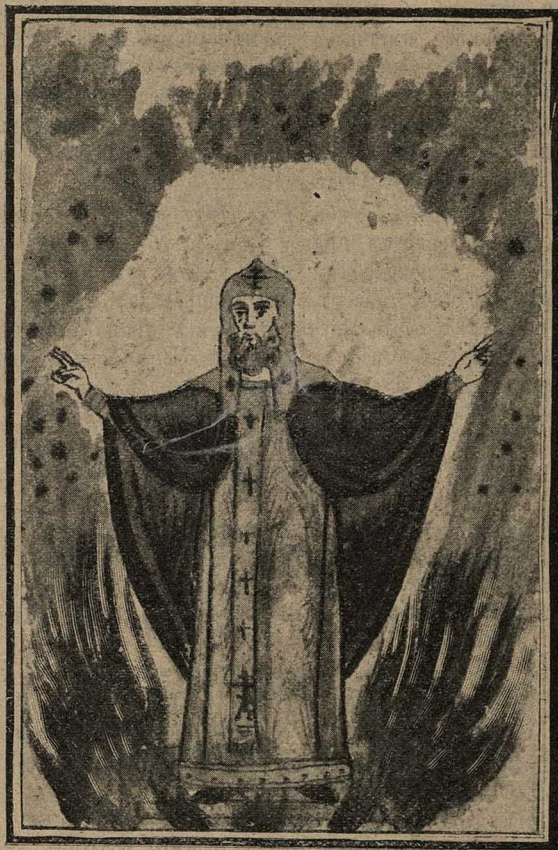
Епископъ Павелъ Коломенскій на кестрѣ.

Стихъ. Священницы Твои облечутся въ правду, и преподобнии Твои возрадуются. Всяко дыханіе. Евангеліе отъ Иоанна, зач. 36. По 50-мъ псалмѣ стихира гласъ 6-й: Егда сожженіе Твое. Пѣнь на хвалит. Канонъ иже во святыхъ стцу нашему Павлу Коломенскому епископу, гласъ 6-й.