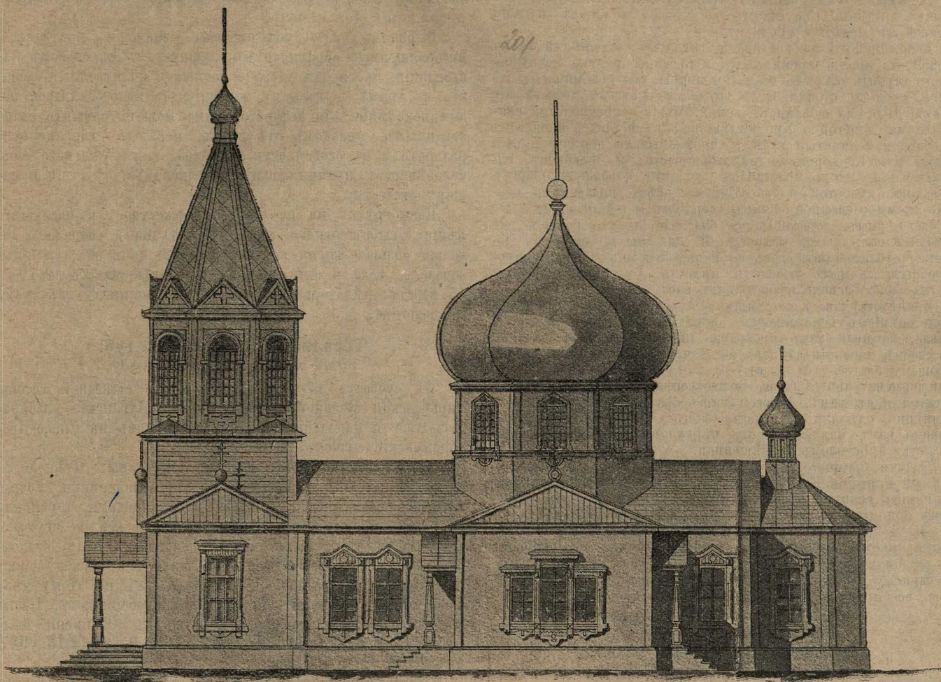
Старообрядч. церковь во имя Покрова Пресв. Богородицы въ селѣ Ольховатиѣ, Екатеринбургской губерніи.