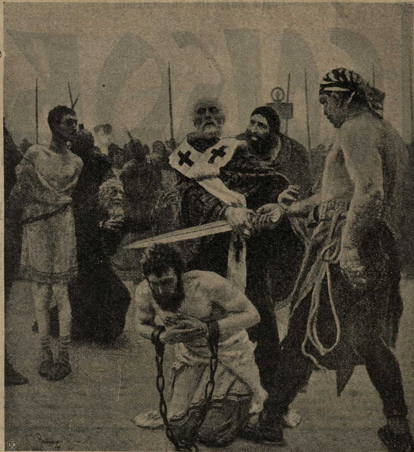
Святитель Никола Чудотворецъ спасаетъ отъ казни невинно осужденныхъ.