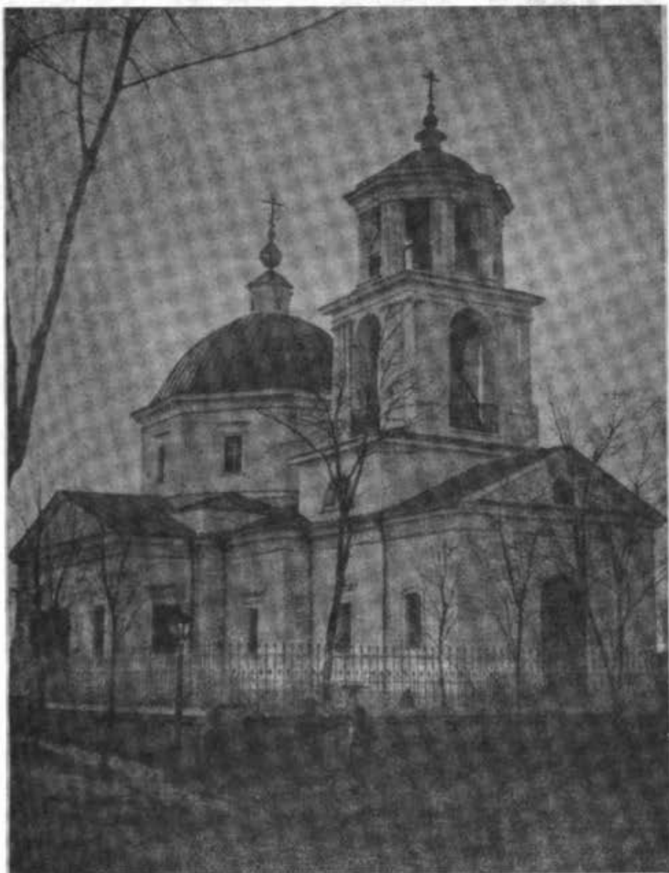
Старообрядческій новый каменный храмъ во имя свят. Николы чудотворца въ г. Измаилѣ, построенъ въ 60-хъ годахъ.