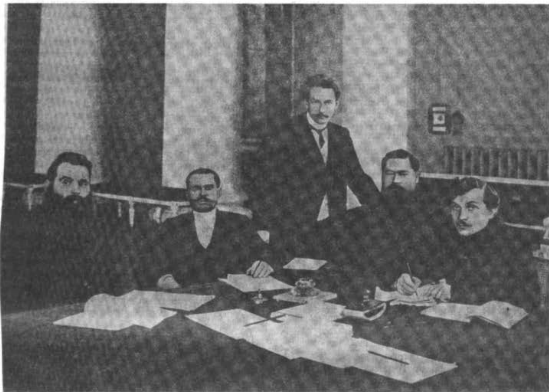
И. Ч. (спиринъ) (Москов. губ.)