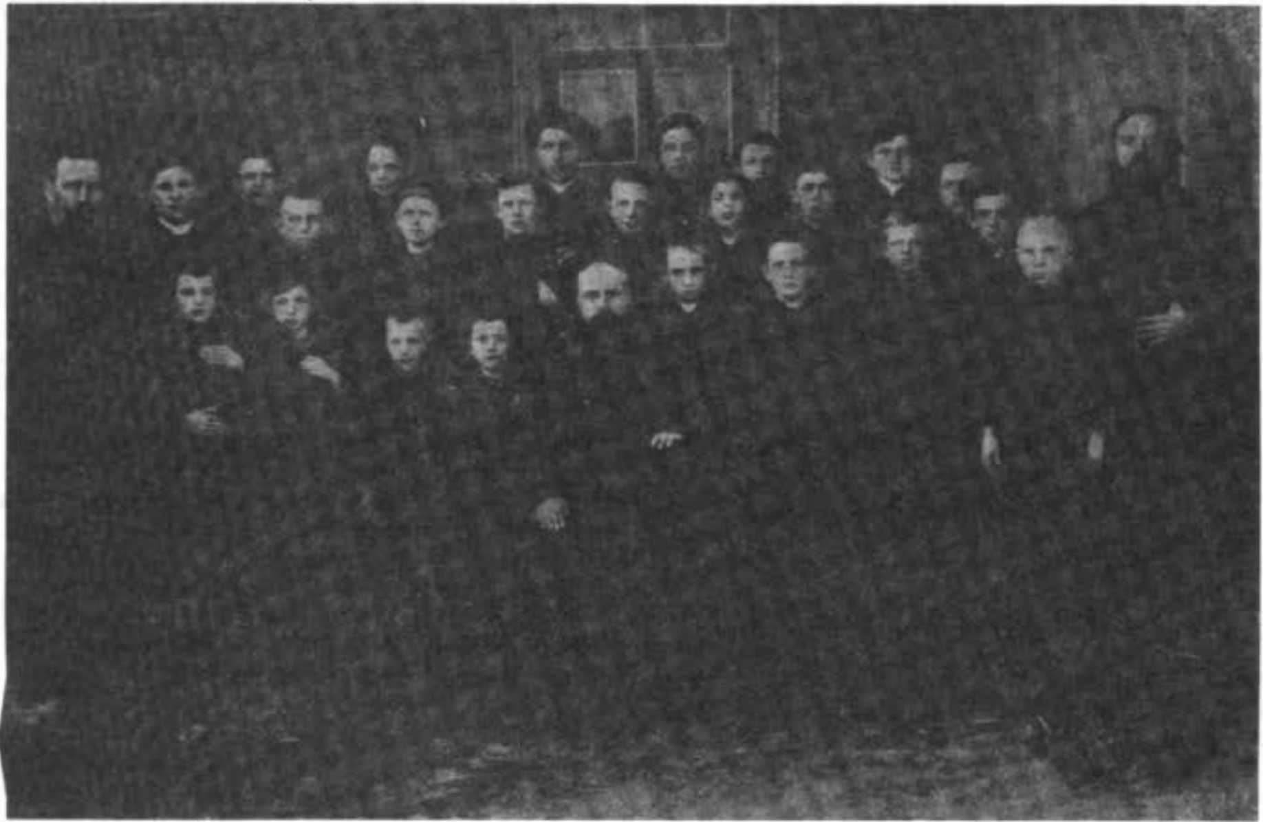
Ученики старообрядческаго училища пѣнія въ г. Боровскѣ, Калужской губ.