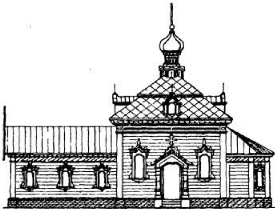
Храмъ въ сл. Абрамовка, Богородскаго уѣзда.