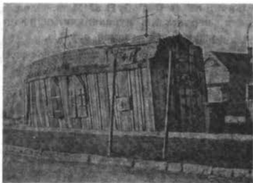
Православный кафедральный соборъ епископа Серафима въ г. Виннипегъ (Канада)

Храмъ, какъ видно на рисункѣ, совершенно разваливается. По сообщенію нашего корреспондента, отшатнувшаяся отъ сѣнода православная американская паства (русскіе), принявъ священниковъ отъ Серафима, готова на новыя приключенія: Серафимъ, по слухамъ, оказался не епископомъ, а только афонскимъ архимандритомъ, и поэтому приходы начали изгонять поставленныхъ имъ священниковъ (около 60). Совѣтъ всероссійскихъ съѣздовъ старообрядцевъ рѣшилъ разслѣдовать это дѣло путемъ непосредственныхъ сношеній съ канадскими соотечественниками.