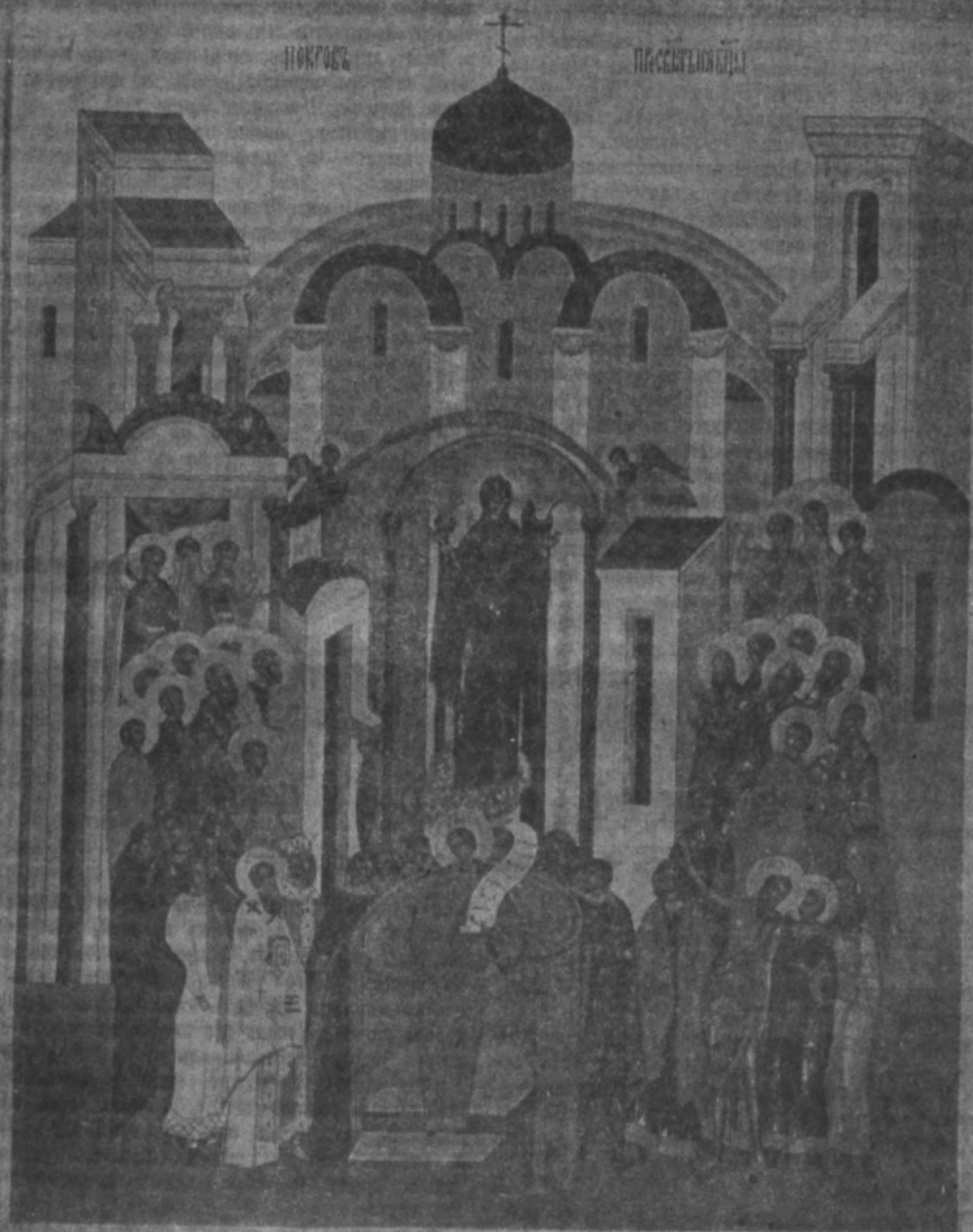
Храмовая икона Покрова Пресвятыя Богородицы въ церкви остоженской общины. (См. статью В. Борина).