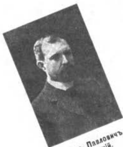
Павелъ Павловичъ Рябушинскій.