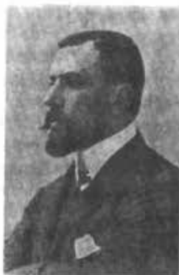
Председатель совѣта Степанъ Павловичъ Рябушинскій.