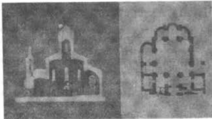
Планъ Покровскаго храма Пресвятыя Богородицы остоженской старообрядческой общины.

Этотъ мотивъ проходитъ въ планѣ, представляющемъ греческій равносторонній крестъ, образуемый перекрещивающимися подиружными арками (древній новгородскій типъ перекрытія), на которомъ основана трибуна (верхъ) съ одной маковицей.