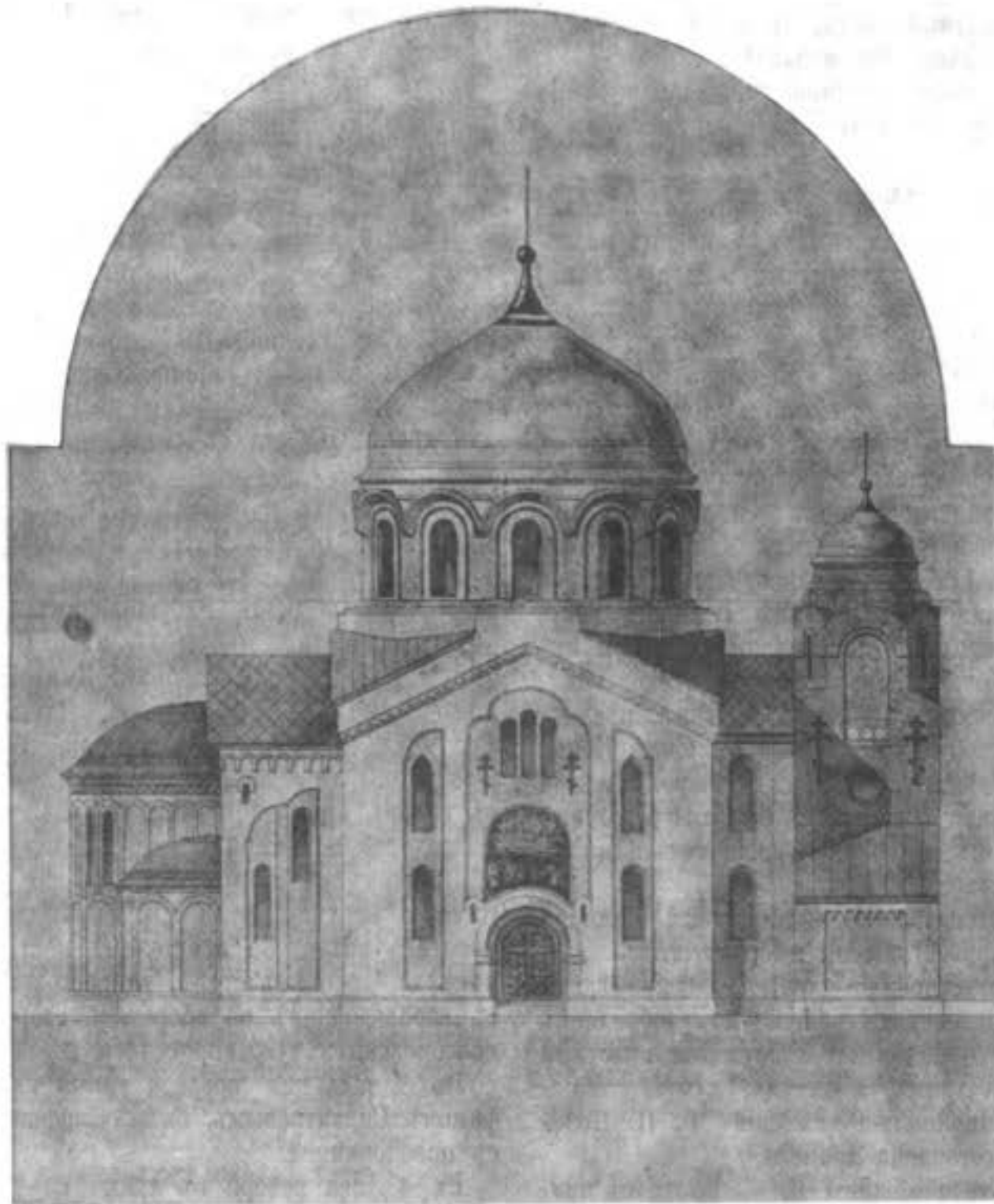
Проектъ храма старообрядческой замоскворѣцкой общины, закладка котораго была 12 октября сего года.