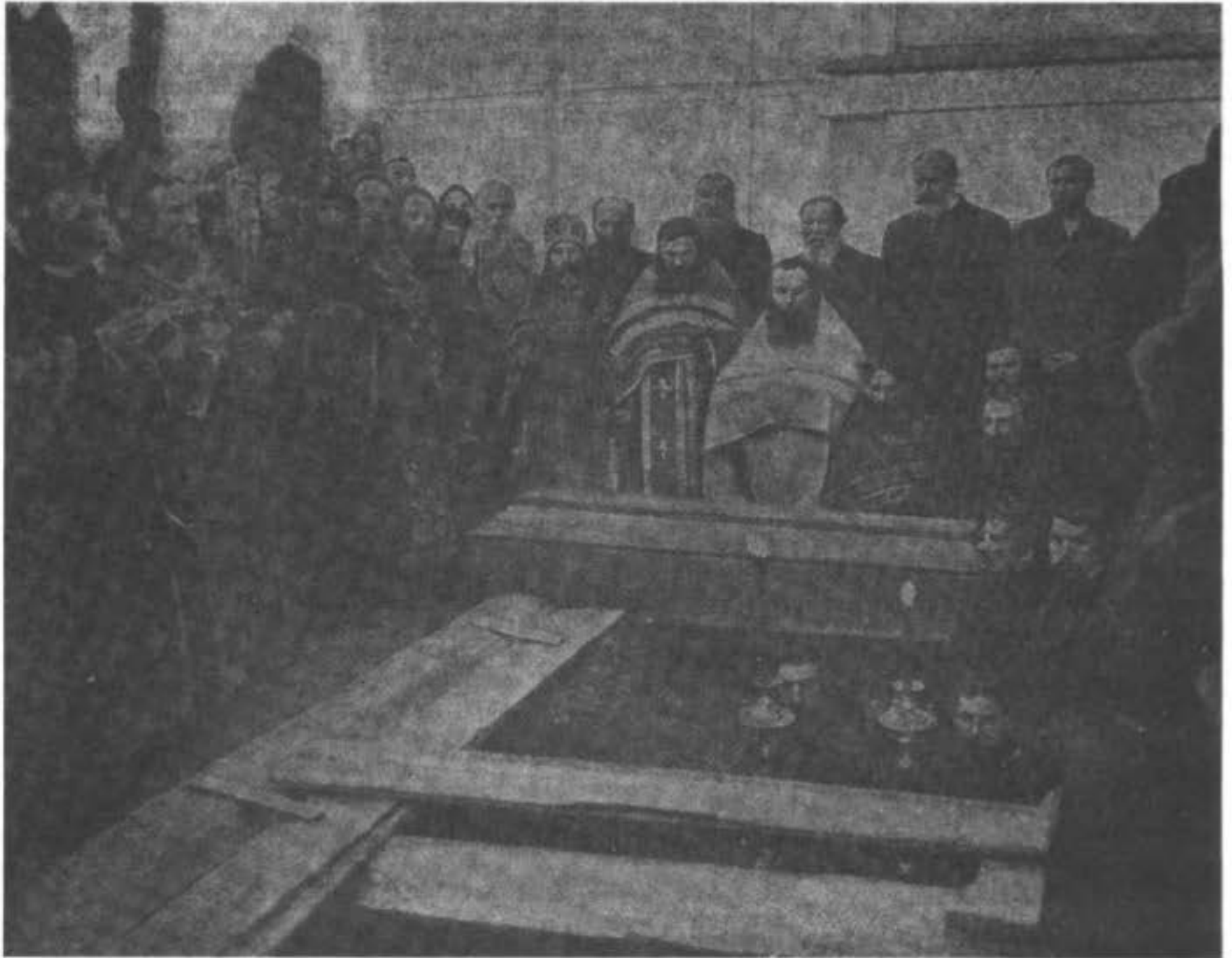
П о г р е б е н і е