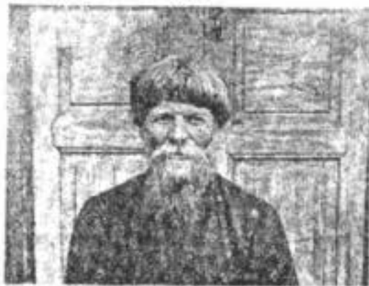
Настоятель корельской моленной поморцевъ.

Этотъ трудный вопросъ о томъ, какъ и изъ-за чего возникъ расколъ въ церкви русской, а также кто былъ виновникомъ его возникновенія, рѣшается у Мордовцева довольно просто и легко. Не соглашаясь ни съ тѣми, которые виновникомъ раскола считаютъ патриарха Ни-