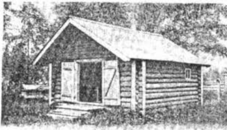
Могила старца Сафонтія. Наружный видъ.