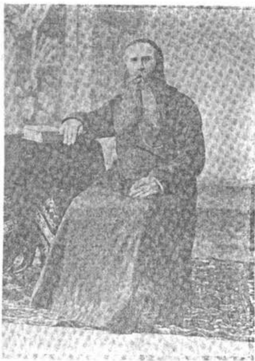
Новопосвященный епископъ саратовскій Мелетій (въ бытность его священникомъ).

Въ воскресенье, 7-го декабря, въ Христорожественскомъ храмѣ Рогожскаго кладбища при торжественной