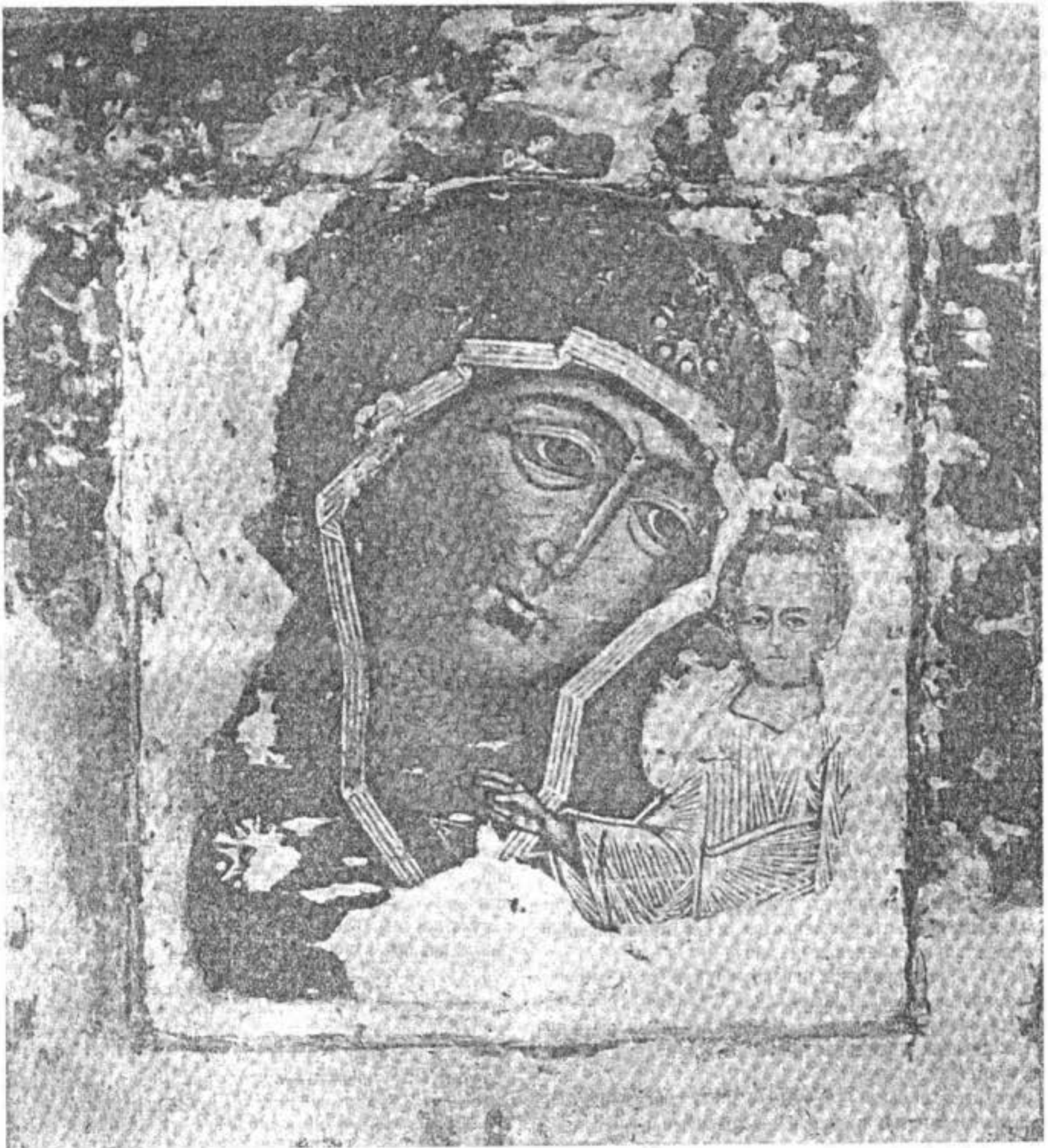
Образъ Пресвятыя Богородицы, именуемая „Назанскія“, второй половины XVI в., послѣ расчистки и снятія воѣхъ наносныхъ слоевъ и записей.

Съ половины 17 вѣка и до начала 19 вѣка реставраторы и иконописцы, къ сожалѣнію, мало обращали