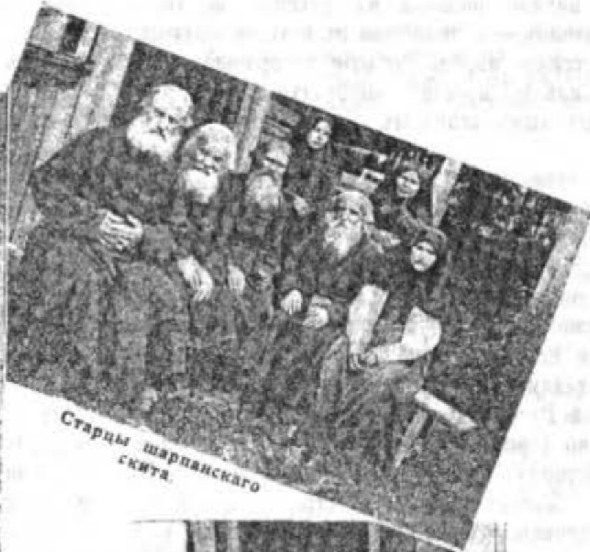
Старцы шарпанскаго скита.