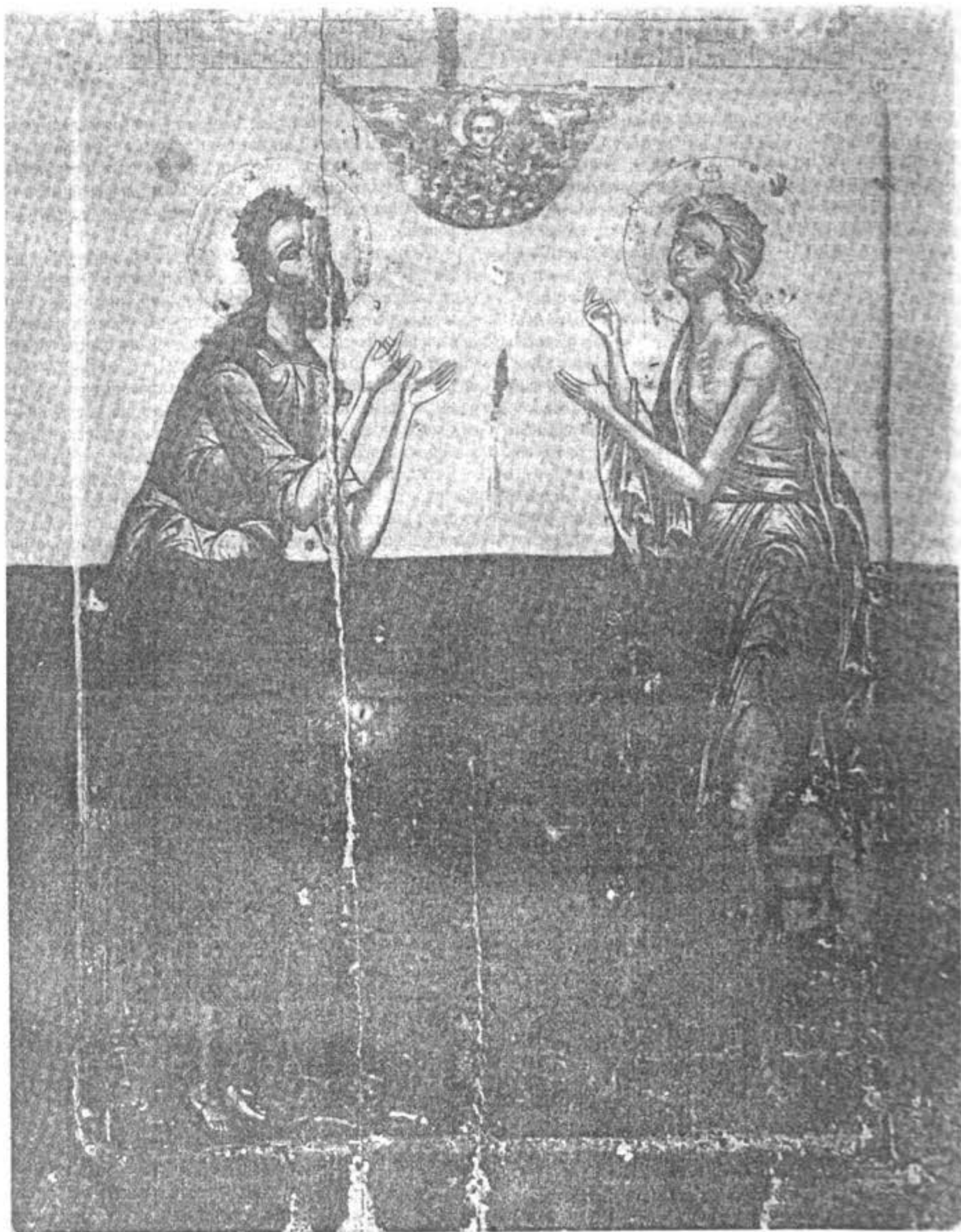
Икона св. Алекоја „человѣка Божіа“ и св. Маріи Египетской; расчищенная половина: грунтъ сверху желтый, а внизу зеленый; икона, какъ надо полагать, двухъ записей.