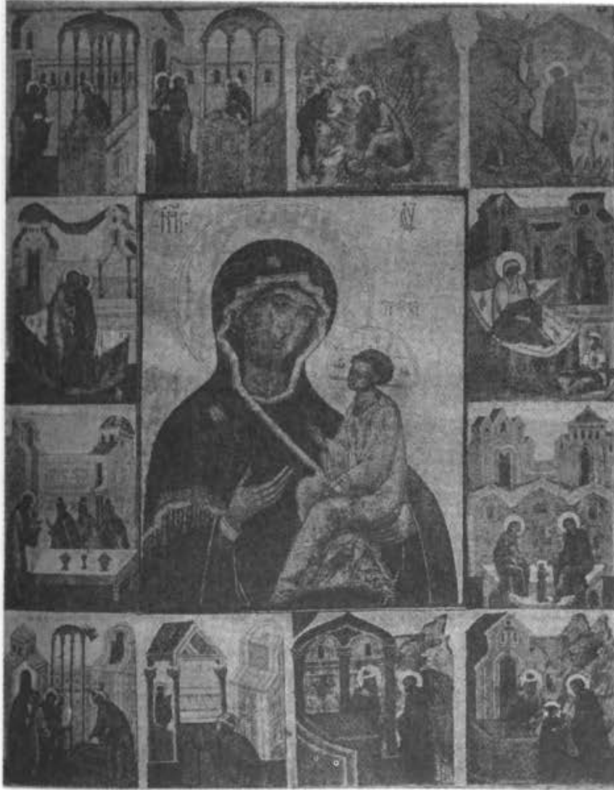
Тихвинская икона Пресв Богородицы. (Изъ собранія П. М. Третьякова).

Сие же есть свидѣтельство Божества Христова. Надъ главою Его назнаменовано надписаніе \text{ic} - \text{xc} , еже