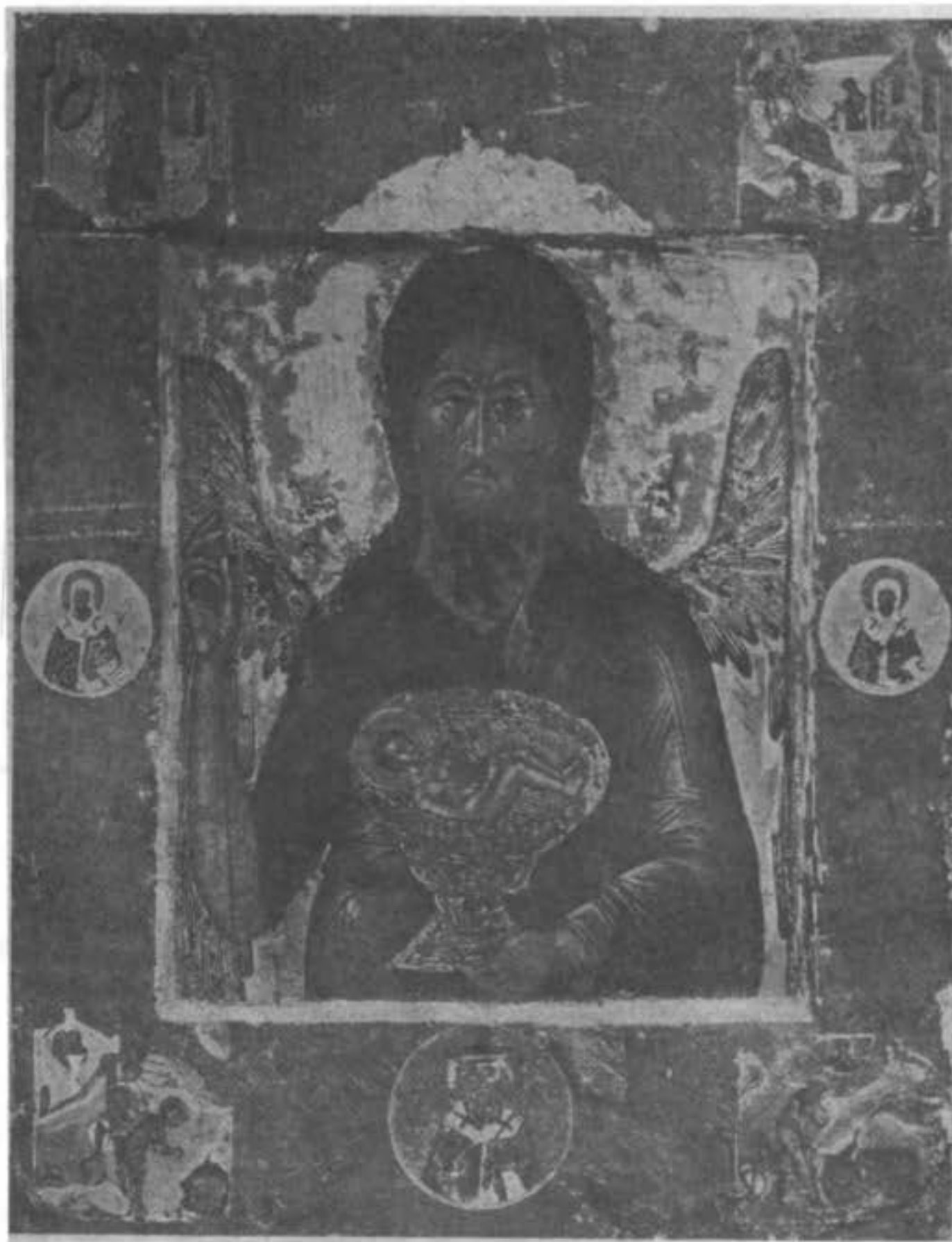
Св. икона Іоанна Предотечи. (Изъ собранія П. М. Третьякова).

стію; но велія и безмѣрныя суть чудодѣйствія, яже содѣваются тою“.