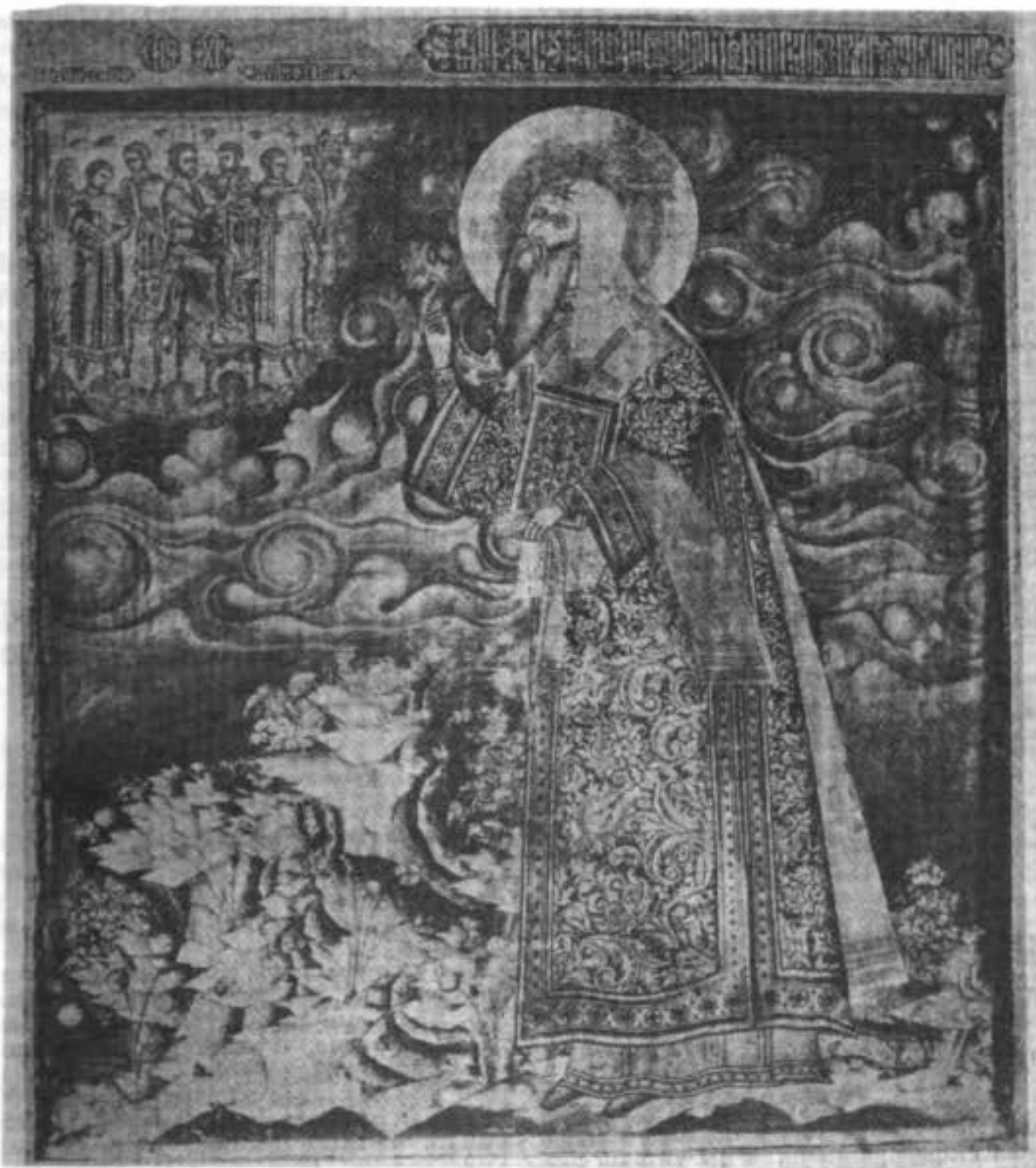
Св. икона Алексія, митрополита московскаго и всея Россіи чудотворца. (Изъ собранія П. М. Третьякова).

Въ чашѣ возлежитъ „се Агнецъ Божій, который беретъ на себя грѣхи міра“. Наименованіе ангела усвоено