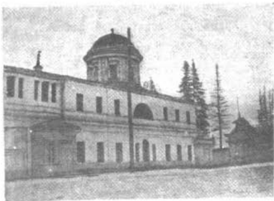
Часть Харитоновскаго дома въ г. Екатеринбургѣ, въ которомъ находится старообрядческій храмъ.

Далеко не всѣ знаютъ, что въ Екатеринбургѣ въ такъ называемомъ Харитоновскомъ домѣ существуетъ старообрядческая церковь. Церковь эта помѣщена во второмъ этажѣ и алтаремъ обращена... въ извѣстный Харитоновскій садъ, предназначенный для гуляній. Надъ алтаремъ