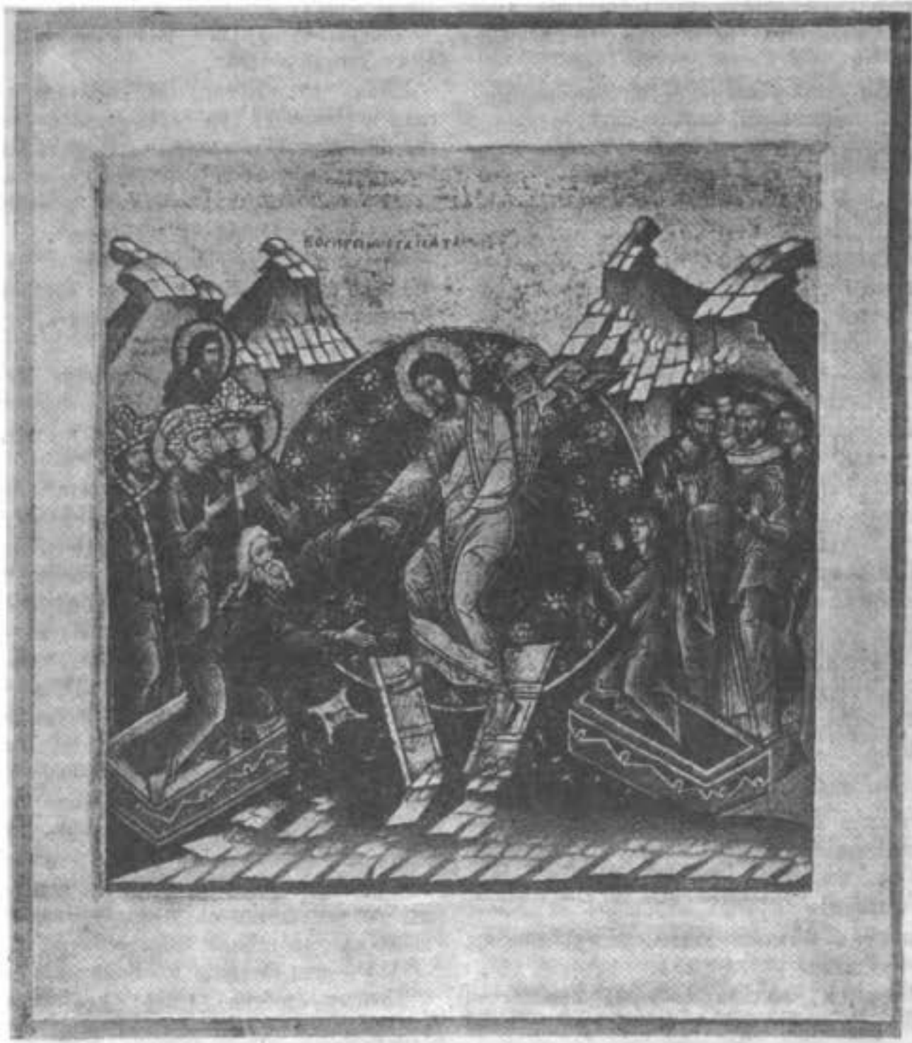
Образъ „Воскресеніе Христово“ изъ храма при остоженской общинѣ въ Москвѣ