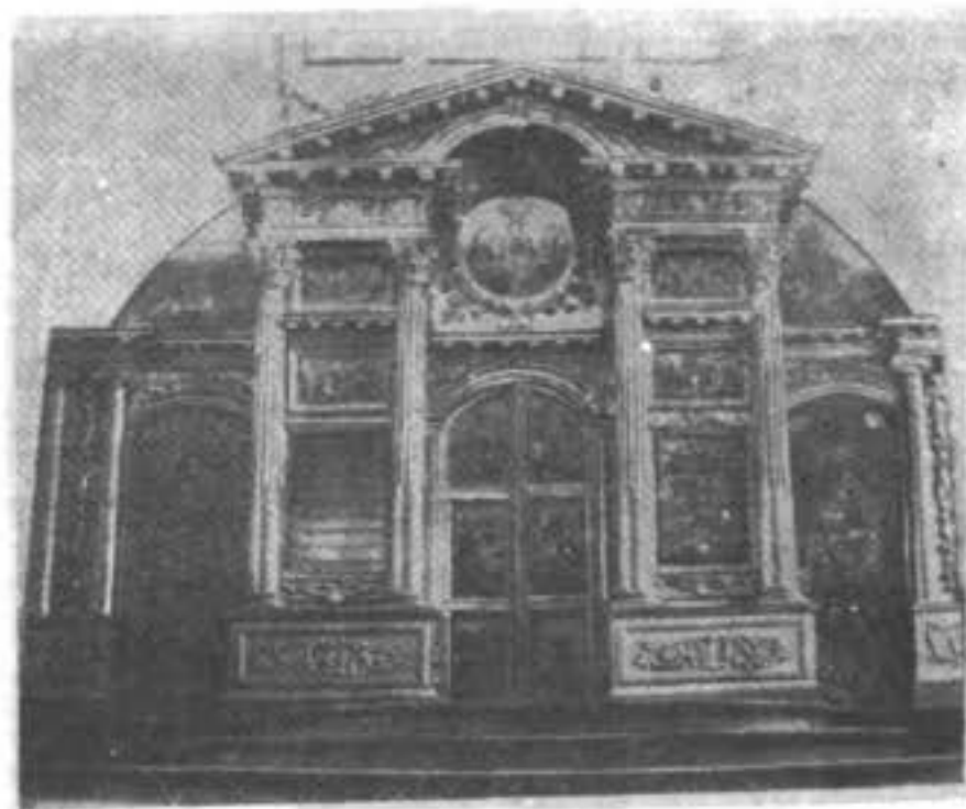
Иконостасъ въ Харитоновскомъ старообрядческомъ храмѣ въ г. Екатеринбургѣ.

И вотъ уже не одинъ десятокъ лѣтъ стоитъ онъ заброшенный, пустой, покинутый потомками тѣхъ, которые, преслѣдуемые властью, все-таки собирались сюда и возносили Господу Богу горячія молитвы, прося Его „превратить гнѣвъ на милость“ и освободить ихъ отъ напрасныхъ притѣсненій. Пора пришла: притѣсненій нѣтъ.