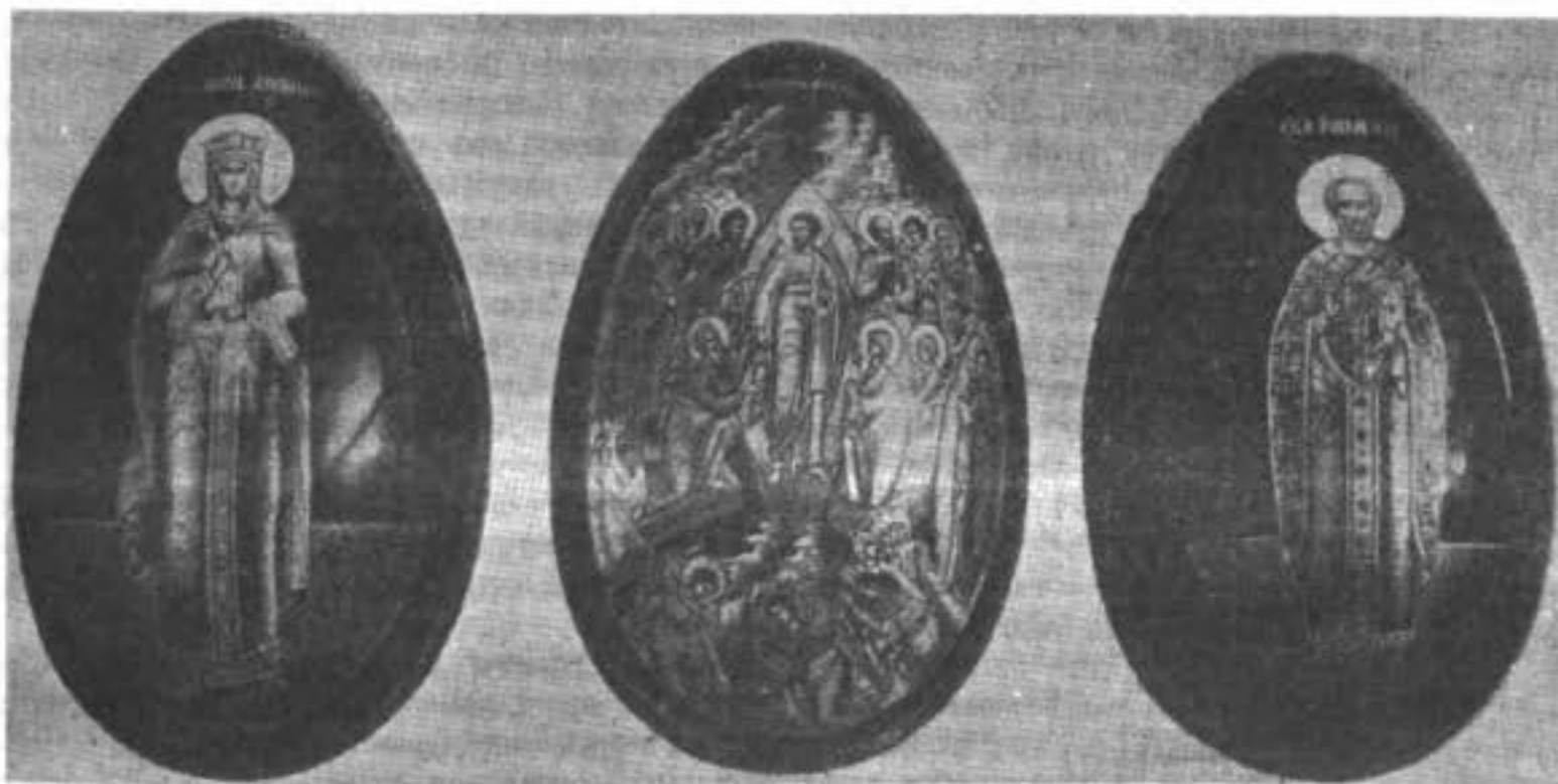
Снимки съ яицъ, подносимыхъ представителями Рогожскаго кладбища Высочайшимъ Особамъ при христосованіи

Что касается новыхъ обрядниковъ, то дѣйствительно они не только не тревожились тѣмъ, что гнила жизнь и душа людей оставалась въ скотствѣ, но сами всѣми средствами, самыми безцеремонными и преступными,