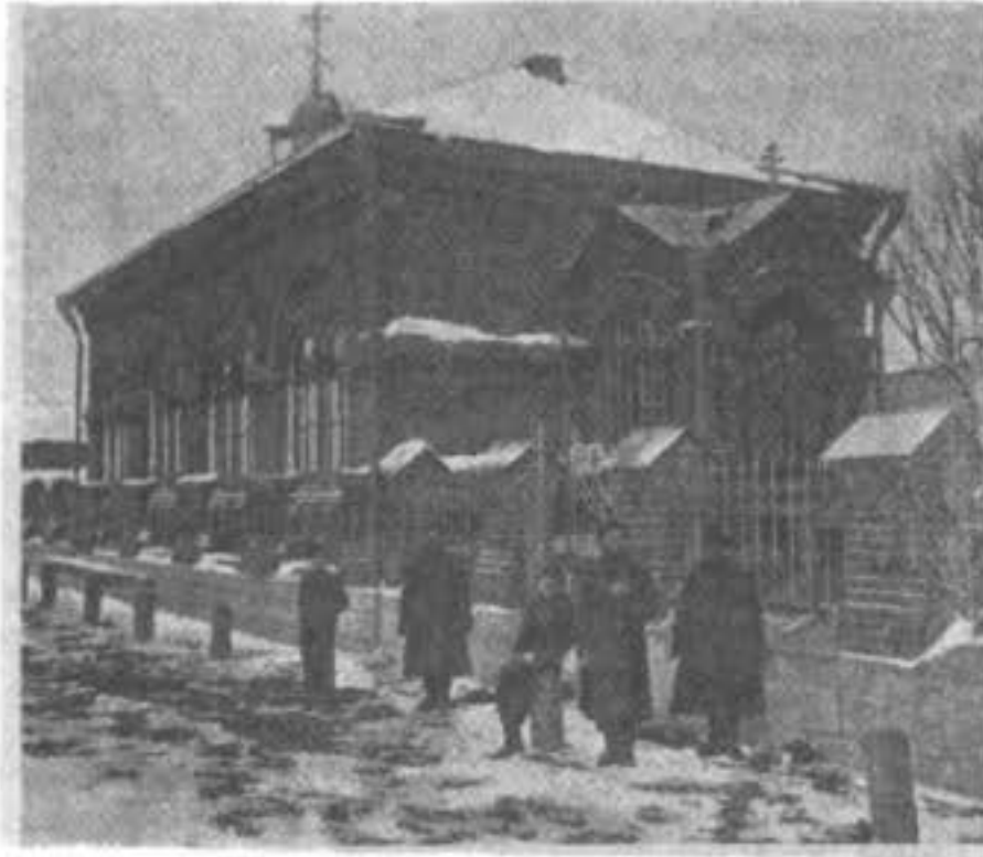
Наружный вид чертенскаго старообрядческаго храма Рождества Богородицы.