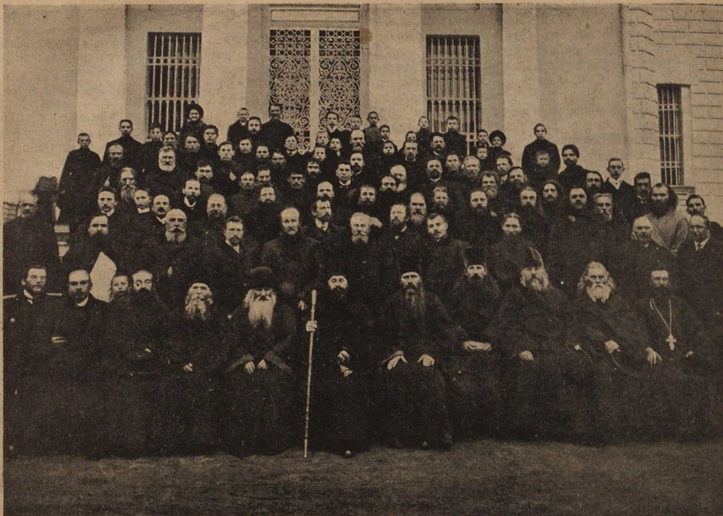
1-й синодальный съезд московской епархии в Москвѣ 25—30 октября 1909 года.

браться, совместно выработать мѣры борьбы съ общимъ упадкомъ религіозности и противостоять быстро надвигающейся на насъ опасности безбожія и безвѣрія. Наконецъ, собраться даже для того, чтобы каждый изъ насъ могъ, видя поддержку остальныхъ, тверже стоять за свои убѣжденія и внести посильную лепту своему обществу, обремененному всякаго рода нестроениями. Представляя изъ себя малые религіозные кружки, разбросанные крайне неравномерно по лику земли российской и даже за предѣлами ея, синодальцы годъ за годомъ чувствуютъ неопредѣленность и тяготу своего положенія. Съ одной стороны, нежеланіе понять, и нападки братьевъ-старообрядцевъ, съ другой — незнакомство съ духомъ синодальства церковной власти и пренебреженіе насущныхъ законныхъ потребностей правительственной властью создавало и создаетъ пагубное стѣсненіе синодальцамъ. Если ко всему этому прибавить и разладъ между самими членами синодальныхъ обществъ, то грустно становится за правое дѣло синодальства.