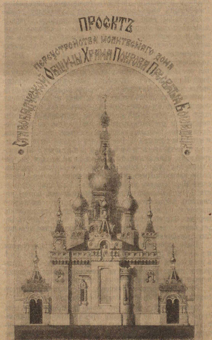
Храмъ одесской общины Покрова Пресвятыя Богородицы (съ восточной стороны).

Когда Могилевская губернія была занята французскими войсками, для управленія гражданскою частью