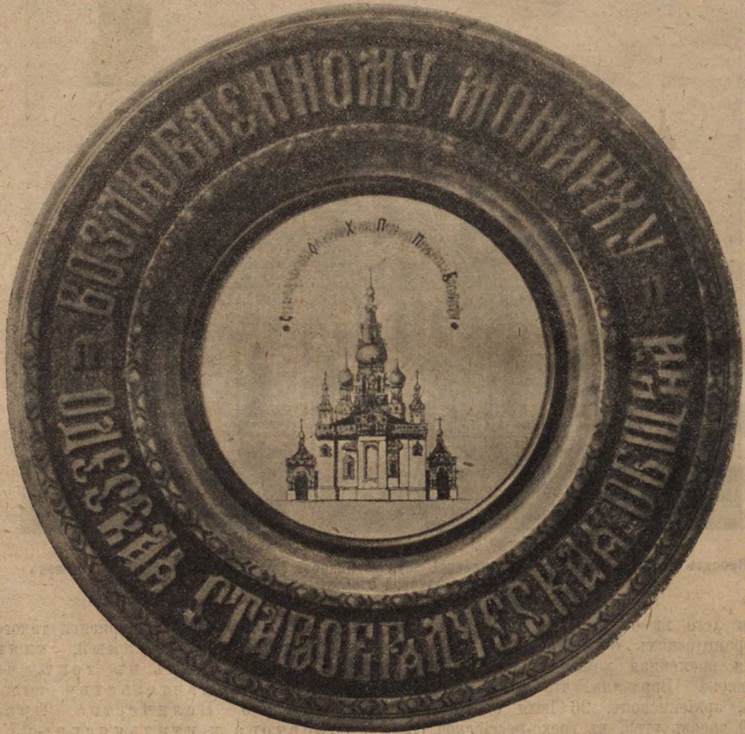
Блюдо, поднесенное Государю Императору депутаціей отъ одесскихъ старообрядцевъ 7 октября 1909 г.

лаамъ никакого отзыва, даже при многократномъ ему напоминаніи не далъ. Изъ отобранныхъ мною,—говоритъ архіепископъ Теофилактъ,—документовъ, находящихся въ консисторіи, видно, что большая часть духовенства могилевской епархіи присягнула на вѣрность императору Наполеону, а архіепископъ Варлаамъ, секретарь консисторіи и члены ея не только сами учинили присягу, но настаивали дубликатами и трипликатами, чтобы и всѣ прочіе послѣдовали ихъ примѣру. Навѣрное можно сказать, что \frac{2}{3} духовенства могилевской епархіи учинило такую присягу,