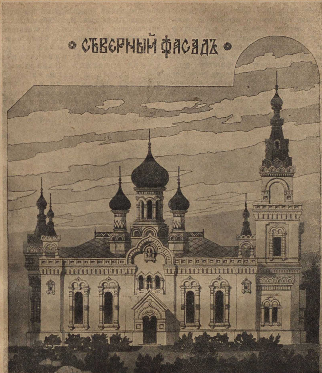
Проект переустройства храма Одесской общины Покрова Пресвятыя Богородицы (снимокъ съ сѣверной стороны).

ея, по повелѣнію „его высочества, маршала великой арміи войскъ французскихъ и соединенныхъ“, была учреждена особая временная коммиссія, которая увѣдомила архіепископа Варлаама, что по приказанію г- маршала, онъ, архіепископъ, 26 іюля (по новому календарю), въ 9 часовъ утра, въ греко-россійской соборной церкви долженъ вмѣстѣ со всѣмъ духовенствомъ города, дворянами и прочихъ состояній гражданами греческаго исповѣданія учинить присягу на вѣрность французскому императору и итальянскому королю великому Наполеону, по окончаніи которой долженъ лично, „какъ первенствующій архипастырь могилевской епархіи,“ совершить литургію, поминая отнынѣ, а равно и на благодарственномъ молебствіи, вмѣсто императора Александра I французскаго императора и итальянскаго короля великаго Наполеона, и чтобы все это было исполнено имъ, архипастыремъ греко-россійской церкви, съ приличнымъ торжествомъ не только въ Могилевѣ, но и во всѣхъ приходахъ епархіи, а потому и долженъ отъ послать стѣ себя повѣстку по городу Могилеву и по епархіи и о послѣдующемъ увѣдомить временную коммиссію“. При этомъ отношеніи временной коммиссіей