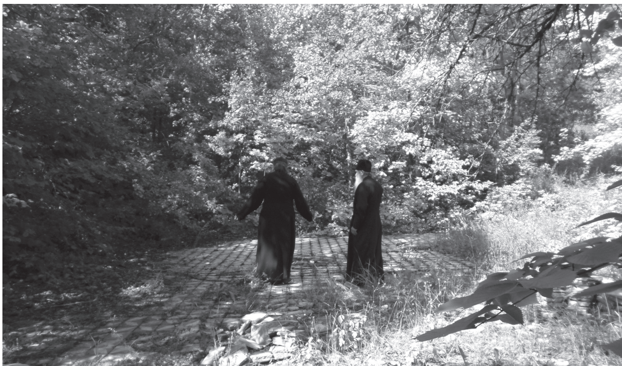
Бывшее кладбище и старая танцплощадка

Но если советская власть терпимо отнеслась к постройкам, сохранив их на территории обоих монастырей, возведя среди них современные и поставив рядом с ними гипсовые скульптуры – от вождя революции до разного рода «спортсменов», – то в начале 1990-х годов постройки и территория мужского монастыря были проданы местной администрацией некоему акционерному обществу. Забвение основ веры, народных традиций в быту и труде – всего, что так бережно хранили старожилы – превратило святое место, цель палом-