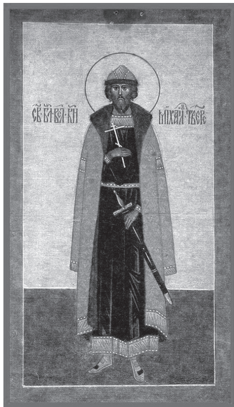
Святой благоверный великий князь Михаил Тверской. Икона. XX в.

Когда же пришла она в совершенный возраст, чтобы вступить в сочетание браком, обручили её великому князю Михаи́лу Ярославичу, который тогда властвовал в городе Твери 2 . Так же и тот благоверный князь Михаил был весьма благочестив и Боголюбив, смирением, кротостью и благотворением к нищим и к странникам устраивая всё, после же скончался мученическим подвигом, и венцом мучения увенчан рукой Вседержителя, как об этом будет сказано позже.