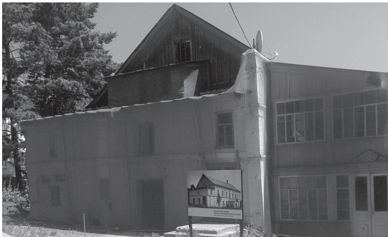
Успенский собор Свято-Успенского монастыря сегодня