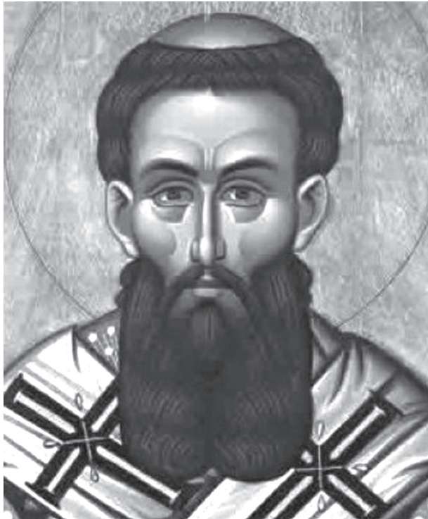
Святитель Григорий Палама.

В КОТОРОЙ ДОКАЗЫВАЕТСЯ, ЧТО СВЕТ, БЫВШИЙ ПРИ ПРЕОБРАЖЕНИИ, ЯВЛЯЕТСЯ НЕСОЗДАННЫМ