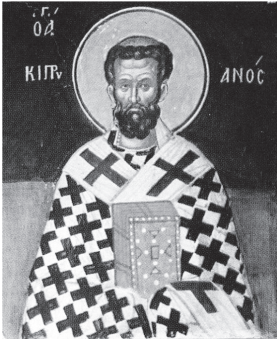
Свщч. Киприан Карфагенский

Когда Господь говорит в научение наше: « вы есте соль земли » (Мф. 5: 13); когда Он заповедует нам при незлобии быть простыми и с простотою соединять мудрость (Мф. 10: 16), то не приличнее ли всего нам, возлюбленнейшие братья, предусматривать козни лукавого врага, с сердечной заботливостью и бдительностью предузнавать и избегать их, чтобы, облекшись в Христа — Премудрость Бога Отца, мы не оказались неразумными в охранении своего спасения? Так, должно бояться не того только гонения, которое открытым нападением усиливается поразить и низвергнуть рабов Божиих: там легче уберечься, где очевидна опасность, и дух заранее настраивается к битве, когда неприятель объявляет о себе; гораздо более должно бояться и остерегаться врага в том случае, когда он тайно подкрадывается, когда, обольщая образом мира, непри-