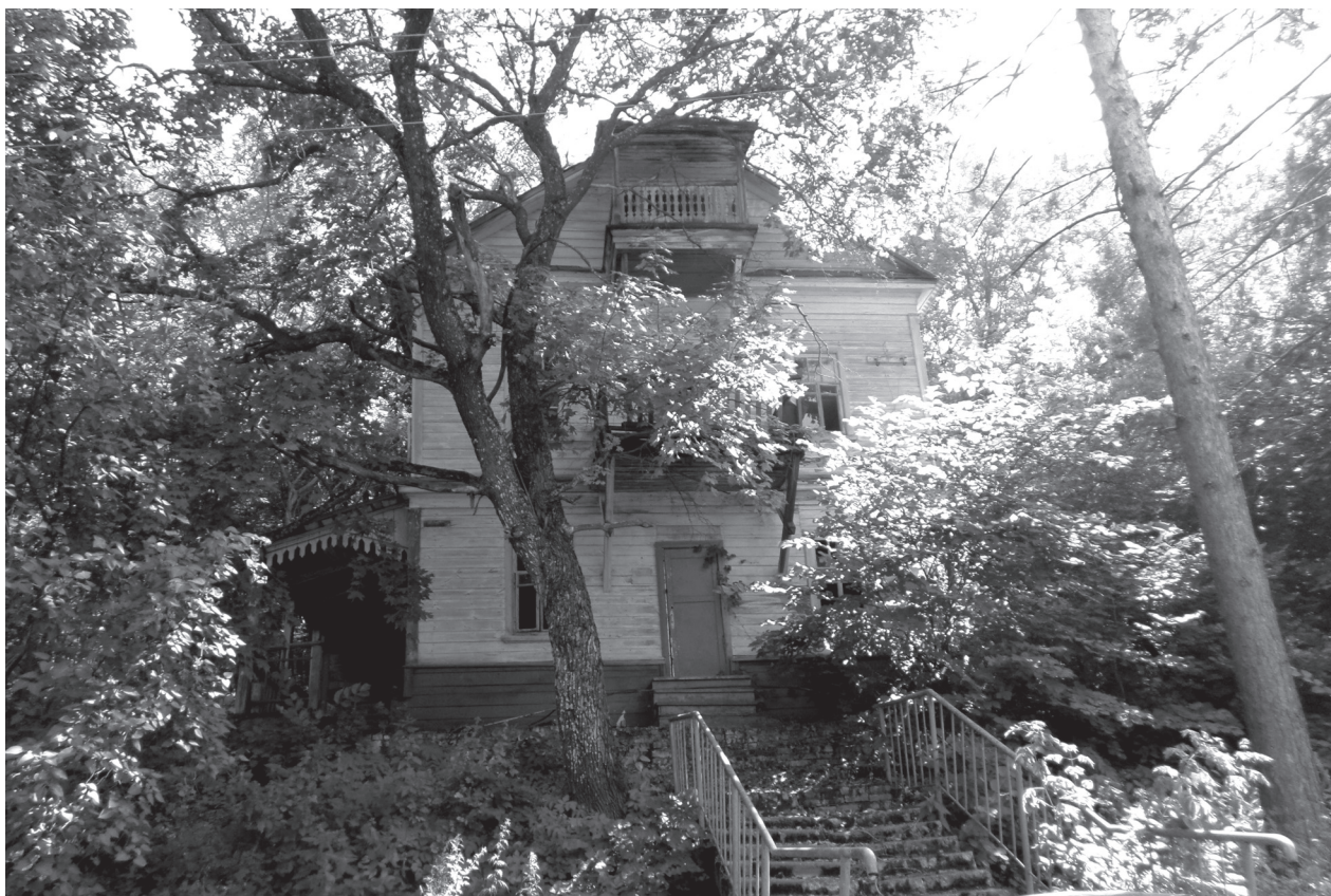
Домик игуменьи Фелицаты можно отреставрировать

Что касается женского монастыря, ныне санатория «Родник», то положение там также печальное, но поправимое. У бывшего храма перестроена верх-