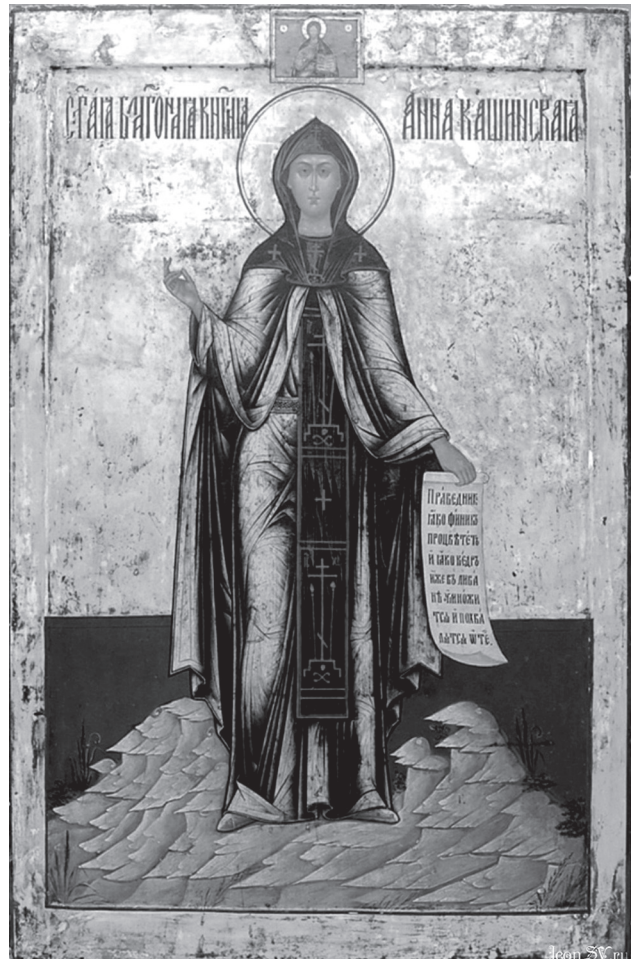
Преподобная Анна Кашинская. Икона XIX в.

Некогда и людям Он проповедовал: «Возьмите на себя Моё иго и научитесь от Меня, как Я кроток и смирен сердцем, и обретёте покой душам вашим, ибо иго Моё благое и бремя Моё легко» (Мф.11:30). И ещё: «Если кто оставит отца или мать, или жену или детей, и землю, и имущество имени Моего ради, стократно получит и наследует вечную жизнь» (Мф.19:29). «И если кто не возьмёт креста своего и не пойдёт за Мною, тот не Мой ученик» (Лк.14:27). И не просто Он учил, но как Бог и Владыка всех, знающий помыслы людей, испытывающий сердца и души, ибо спасение происходит не от простого слышания, но если кто сотворит пречистую волю Его, тот будет спасён. И ещё так Он говорил: если кто слово Моё сохранит, жив будет во веки (ср. Ин.8:51,52). И приняв такое спасительное слово Евангельской проповеди, и открыв борозды своих сердец, многие взяли крест и пошли за Христом, скитаясь в пустынях, в горах и пещерах, и проводя жизнь в пропастях земных – отбегая от прельщения мира сего; и словно получив крылья, как поднебесные орлы, лёгкостью своего разума взлетели на небо: ибо возлюбили Господа Бога всем сердцем и за ним шествовали путь, не возвращаясь назад, и ничто не предпочли Его любви. Как и сия блаженная и великая княгиня Анна, о которой предстоит нам рассказать.