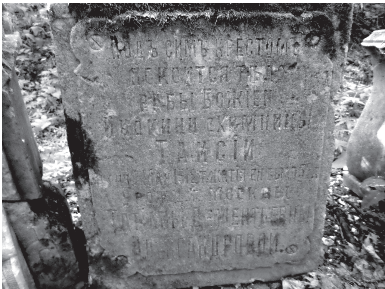
Одно из трёх сохранившихся надгробий

няя часть. Но стены его сохранились: кирпичная кладка, положенная «на века», спасает положение. Сохранился и деревянный двухэтажный домик с широким ступенчатым крыльцом и балконом, в котором проживала игумения-схимница Фелицата. Обветшалый от времени, он требует ремонта.