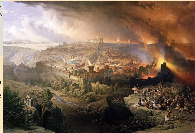
Осада Иерусалима римлянами в 70 году. Дэвид Робертс, 1850 год

Пророчество о разрушении храма сбылось уже в 70 году н.э. Осадившие город римляне разрушили город почти до основания.