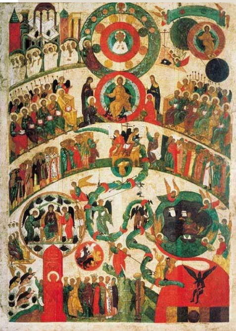
Икона Страшный суд. Новгород, первая половина XV в. Государственная Третьяковская галерея

Накануне Своих страданий Господь с учениками с высокой горы смотрят на благолепный иерусалимский храм. Пребывающие в неведении относительно ближайшего будущего, ученики безмятежно любуются храмом. Господь же неожиданно говорит: совсем скоро от этого храма не останется и камня на камне. Также Он повествует ученикам о Своем втором пришествии.